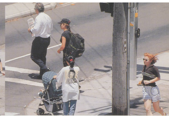
BEAT STREULI, BONDI BEACH/PARRAMATTA ROAD, 1998,

Stillaufnahmen aus Überblende-Diaprojektion, Grösse variabel / stills from fading slide projection, dimensions variable.