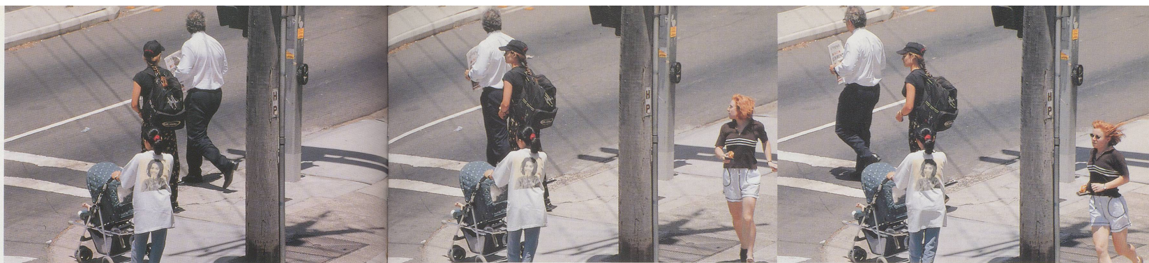
BEAT STREULI, BONDI BEACH/PARRAMATTA ROAD, 1998, Stillaufnahmen aus Überblende-Diaprojektion, Grösse variabel / stills from fading slide projection, dimensions variable.