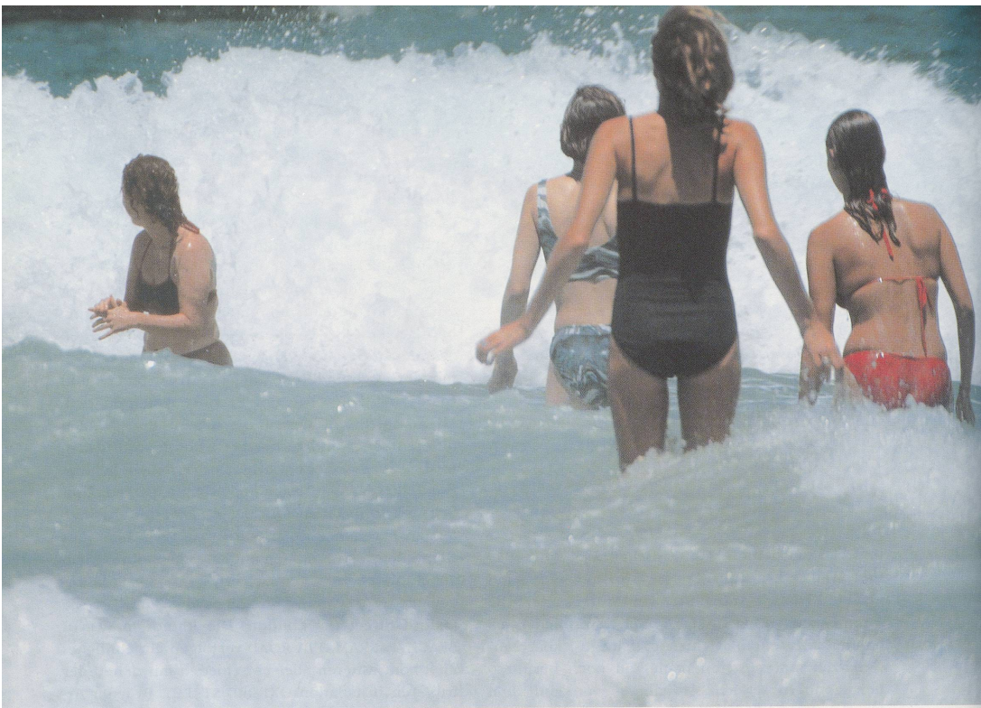
BEAT STREULI, BONDIE BEACH/PARRAMATTA ROAD, 1998, Stillaufnahmen aus Überblende-Diaprojektion, Größe variabel / stills from fading slide projection, dimensions variable.

in einer Art und Weise verbunden, die den meisten europäischen Zentren verloren gegangen ist. An den Stränden von Sydney mischen sich Urlauber und Kinder, die die Schule schwänzen; Familien spielen direkt neben Singles, die beobachten was rundum vor sich geht. Wie die Strasse ist der Strand eine neutrale Zone, wo alle Schichten völlig gleichberechtigt miteinander in Berührung kommen. Aber während die Strasse ein Durchgangsort ist, mit dem gemischte Gefühle verbunden sind, ist der Strand ein Ort, den wir aufsuchen, weil die Brandung uns fasziniert und die Welt der Arbeit vergessen lässt.