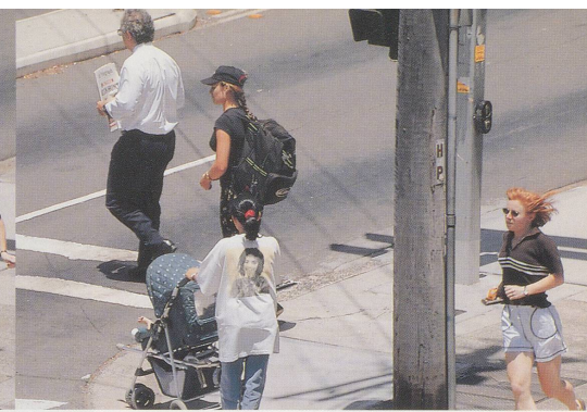
BEAT STREULI, BONDI BEACH/PARRAMATTA ROAD, 1998, Stillaufnahmen aus Überblende-Diaprojektion, Grösse variabel / stills from fading slide projection, dimensions variable.