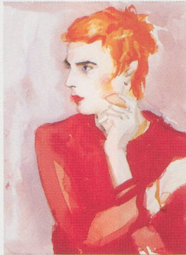
ELIZABETH PEYTON, MARK (SMOKING), 1996, watercolor on paper, 12 x 9" / MARK (RAUCHEND), Aquarell auf Papier, 30,5 x 22,9 cm.