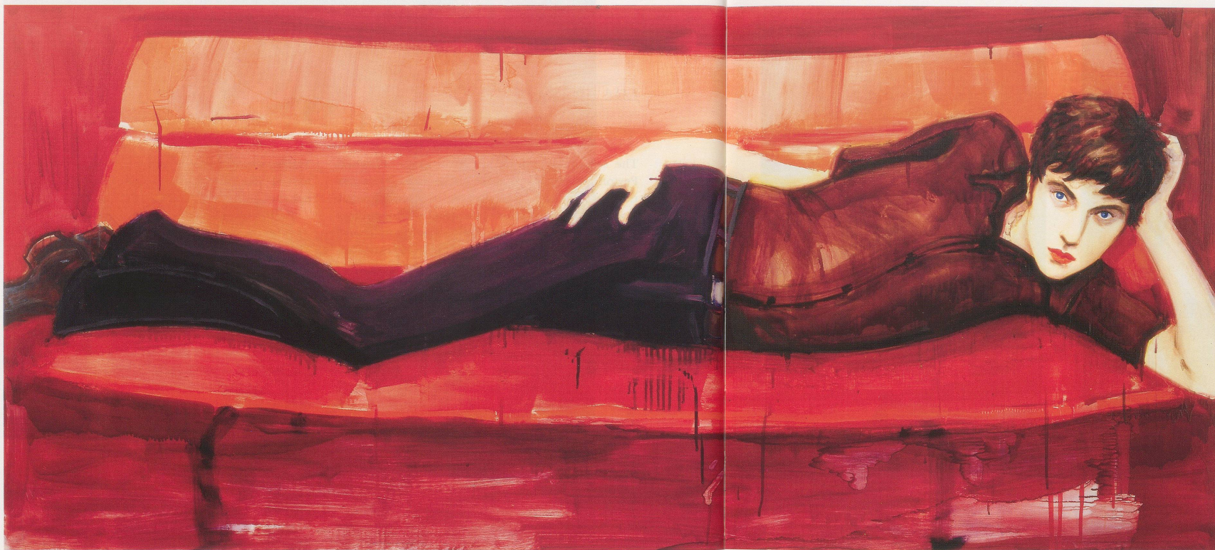
ELIZABETH PEYTON, PIOTR, 1996, oil on canvas, 38 x 86" / Öl auf Leinwand, 96,5 x 218,4 cm.

Peyton's canny-female mode of elegy. This genre, it should be remembered, has a long history in portraiture that reaches back to the breathtakingly successful Madame Elisabeth-Louise Vigée-Lebrun, who worked for nearly all the European monarchies during the late eighteenth and early nineteenth centuries—viz. Peyton's MARIE-ANTOINETTE drawings.