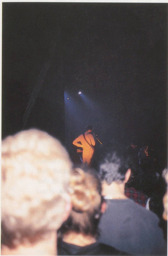
ELIZABETH PEYTON, STEPHEN MALKMUS, ROSELAND BALLROOM, 1997, color photograph / Farbphotographie.