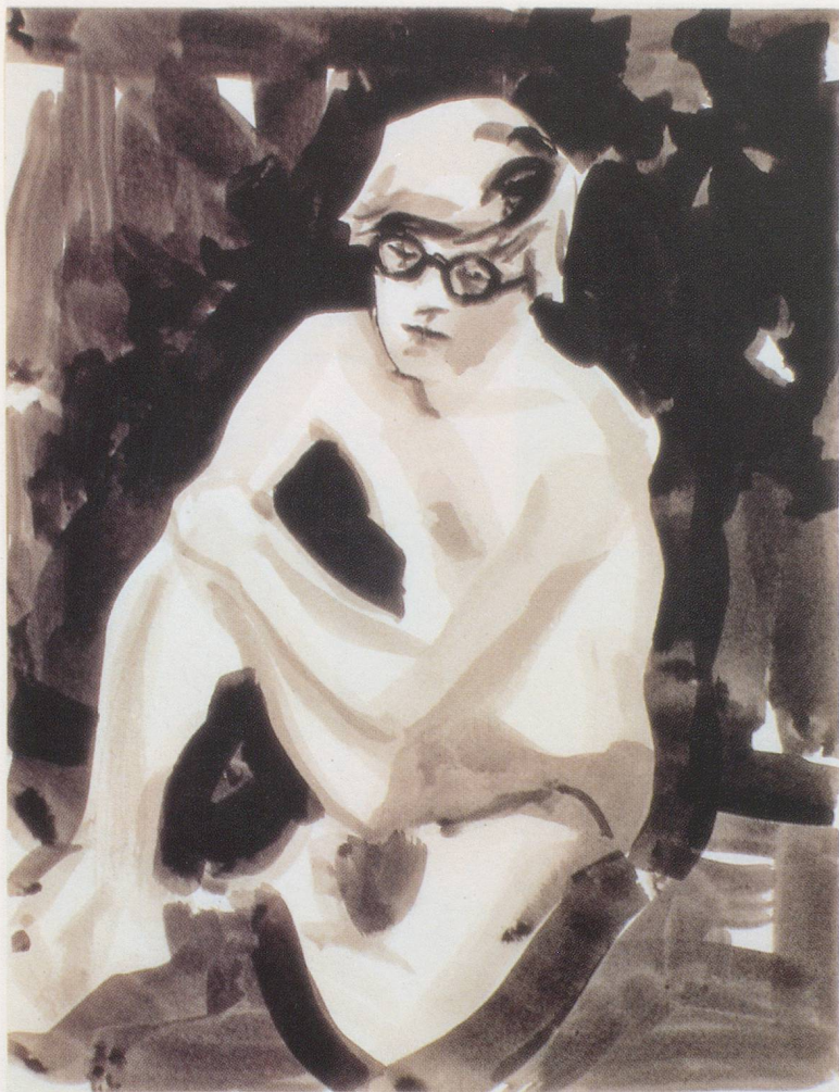
ELIZABETH PEYTON, DAVID HOCKNEY, 1997, ink on paper, 11 x 8½" / Tusche auf Papier, 27,9 x 21,6 cm.