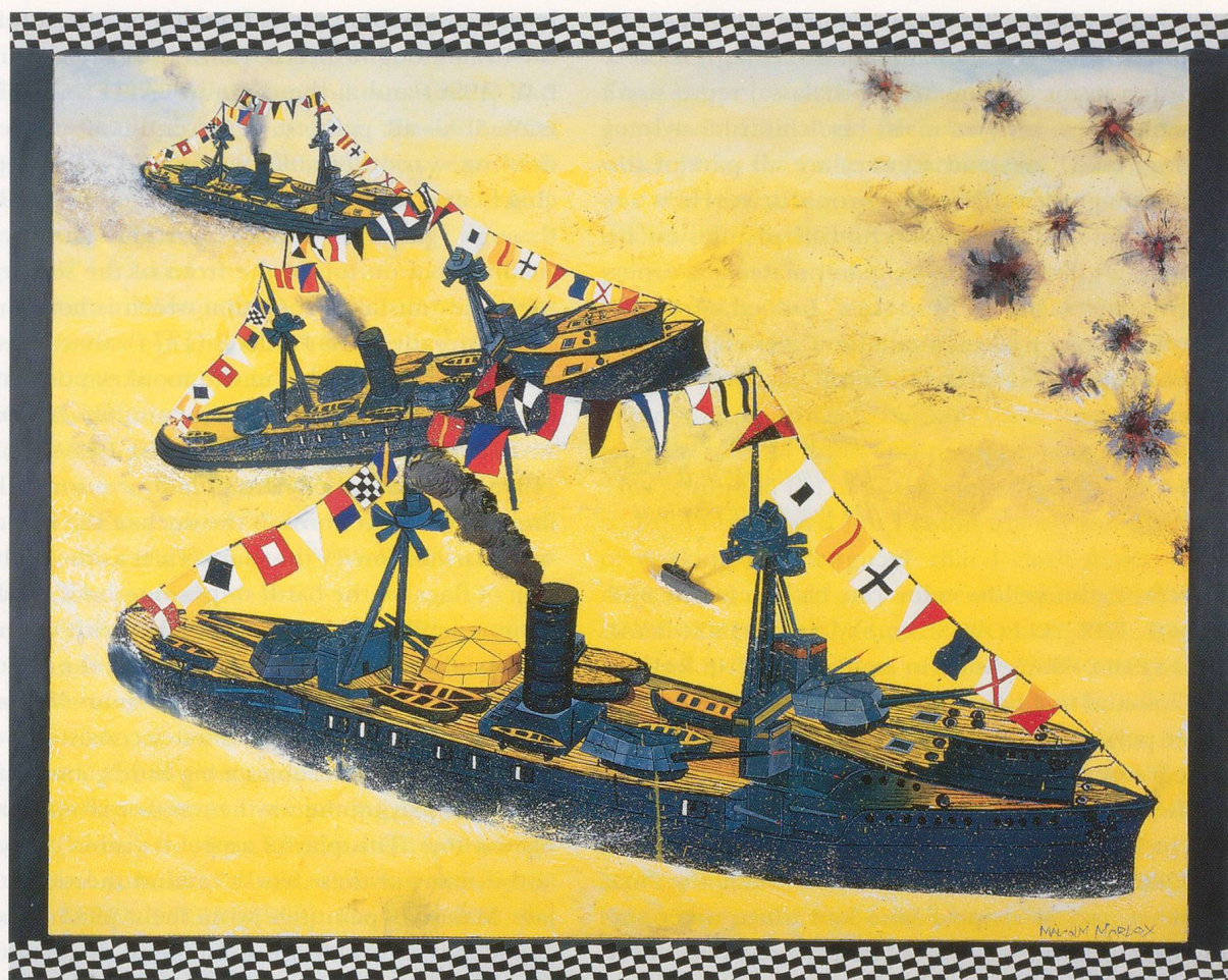
MALCOLM MORLEY, BATTLE OF THE YELLOW SEA , 1996, oil on linen (painted frame attached), 62 \frac{1}{4} x 78 \frac{1}{4} " / SCHLACHT AUF DEM GELBEN MEER , Öl auf Leinwand (mit bemaltem Rahmen), 158 x 199 cm.

affects the viewer in a strangely ambivalent way. What is that dense, opaque yellow fluid supposed to be? Just yellow? Or a visual rendering of the name "Yellow Sea" attached to that large gulf between Korea and China? Or does it suggest the same phantasy that was illustrated in 1907 in a Hungarian satirical magazine by an artist who signed "Bit"—you know, Malcolm, that "bite," pronounced "bit" or "beet," is French slang for cock—an eight-image story found by Ferenczi, studied by Otto Rank and incorporated by Freud into the 1914 edition of The Interpretation of Dreams ? This "Dream of the French Nurse" shows, in the progressive manner of some Little Nemo comic strips, a nurse walking an infant who is expressing an urgent need, then peeing in a street corner, peeing