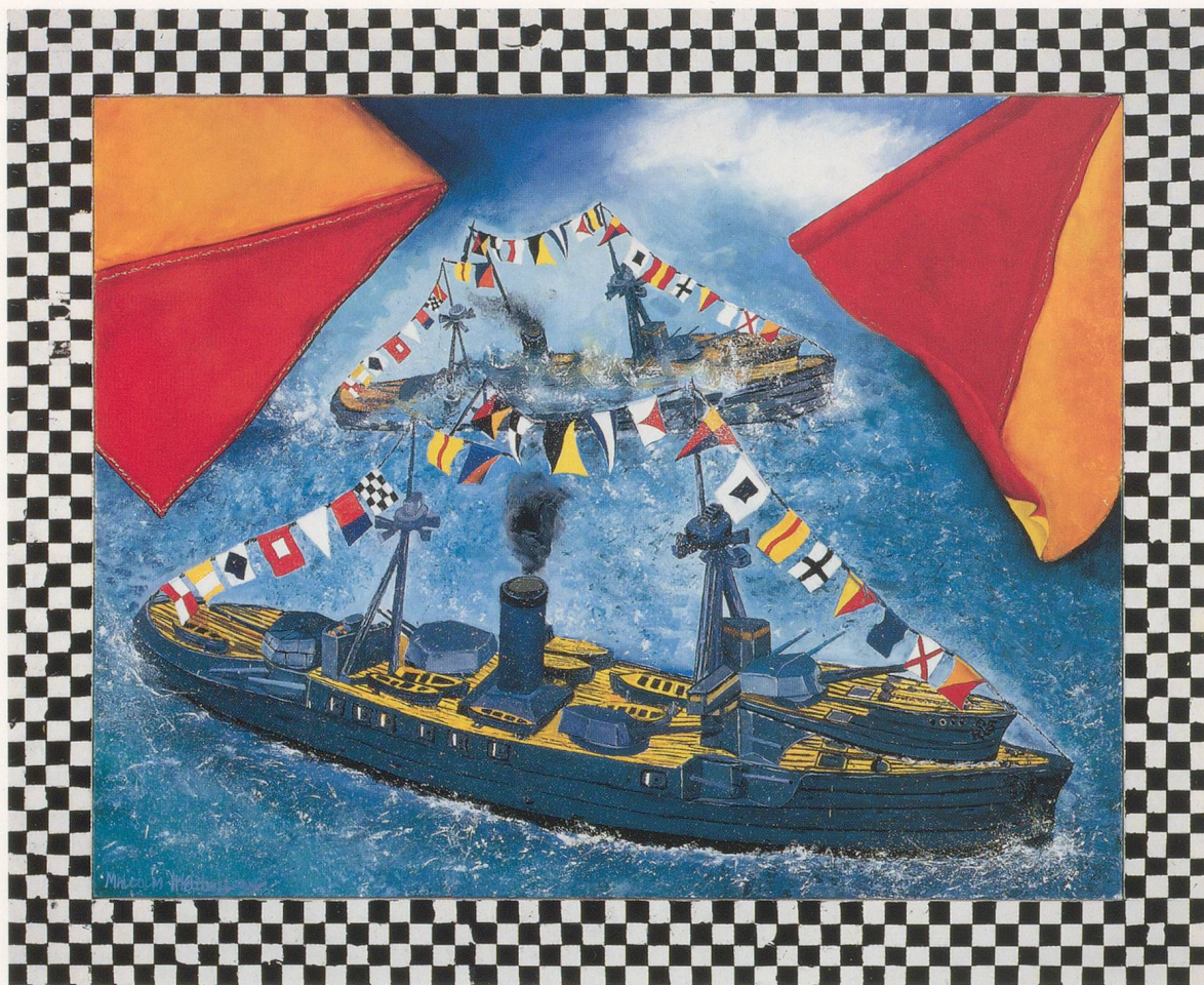
MALCOLM MORLEY, NAVY DAY, 1996, oil on linen, (painted frame attached), 43¼ x 42¼" (2 parts) / TAG DER MARINE, Öl auf Leinen (mit bemaltem Rahmen), 109 x 107 cm (2-teilig).

or repressed desire to return there, what Ferenczi calls "thalassal regression... the idea of an urge to return to the ocean abandoned in primitive times." Coitus, he says, is a substitute for a desire to go back to the mother's womb as a substitute for the primal ocean since "the amniotic fluid figures the ocean 'introjected' into the maternal body." Therefore, "coitus is nothing else but the individual's freeing from a painful tension and simultaneously the fulfillment of the drive to return into the maternal body and into the ocean, model of all motherhood."