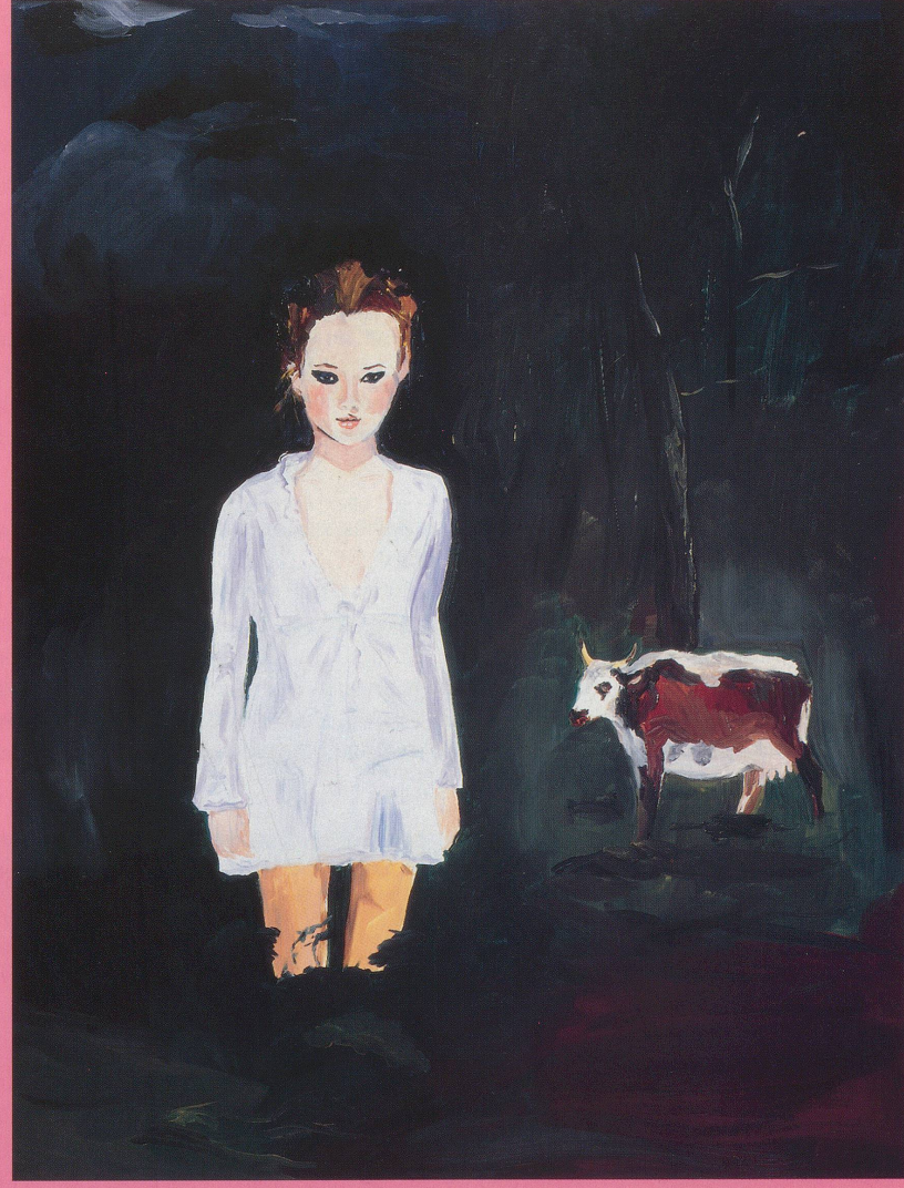
KAREN KILJANNIK, BELGRAVE HALL , 1997, water-based oil on canvas, 18 x 14" / Emulsion auf Leinwand , 45,7 x 35,6 cm.