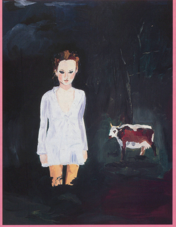
KAREN KILMINIK, BELGRAVE HALL , 1997, water-based oil on canvas, 18 x 14" / Emotions auf Leinwand , 45,7 x 35,6 cm.