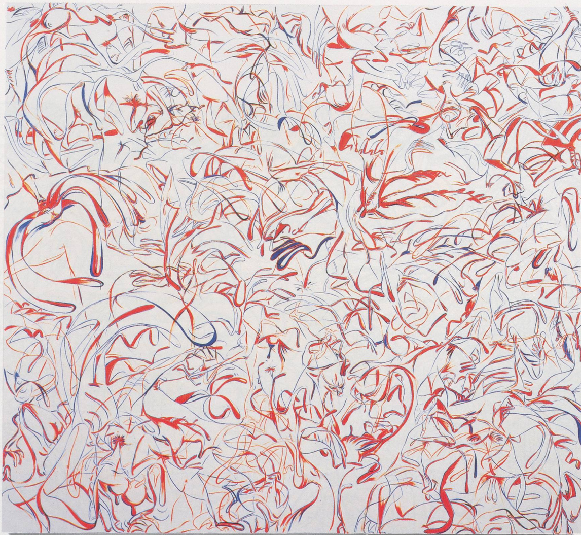
SUE WILLIAMS, MOM'S FOOT BLUE AND ORANGE, 1997, oil and acrylic on canvas, 98 x 108" / MAMAS FUSS IN BLAU UND ORANGE, Öl und Acryl auf Leinwand, 249 x 274 cm.

aufgetragenen Grund, meist eine Art gestrafftes Sprungtuch von hartem Acrylweiss. Im Fall von TWA ist das Tuch gummiert. Da dieser Acryl- oder Gummigrund sich nicht mit Öl verbindet, sind die Linien auch rein materiell betrachtet frei, sich über eine ihnen fremde Oberfläche zu bewegen und ihr Spiel zu treiben, sich in den Ecken zu krümmen und Körperteile aufsteigen zu lassen wie Blasen, eine Kissenlandschaft von Ärschen, Eiern, Titten, eine schnaubende Nase, eine ganze erlesene Gesellschaft von sich ausbreitenden, miteinander wetteifernden Kitzlichkeiten.