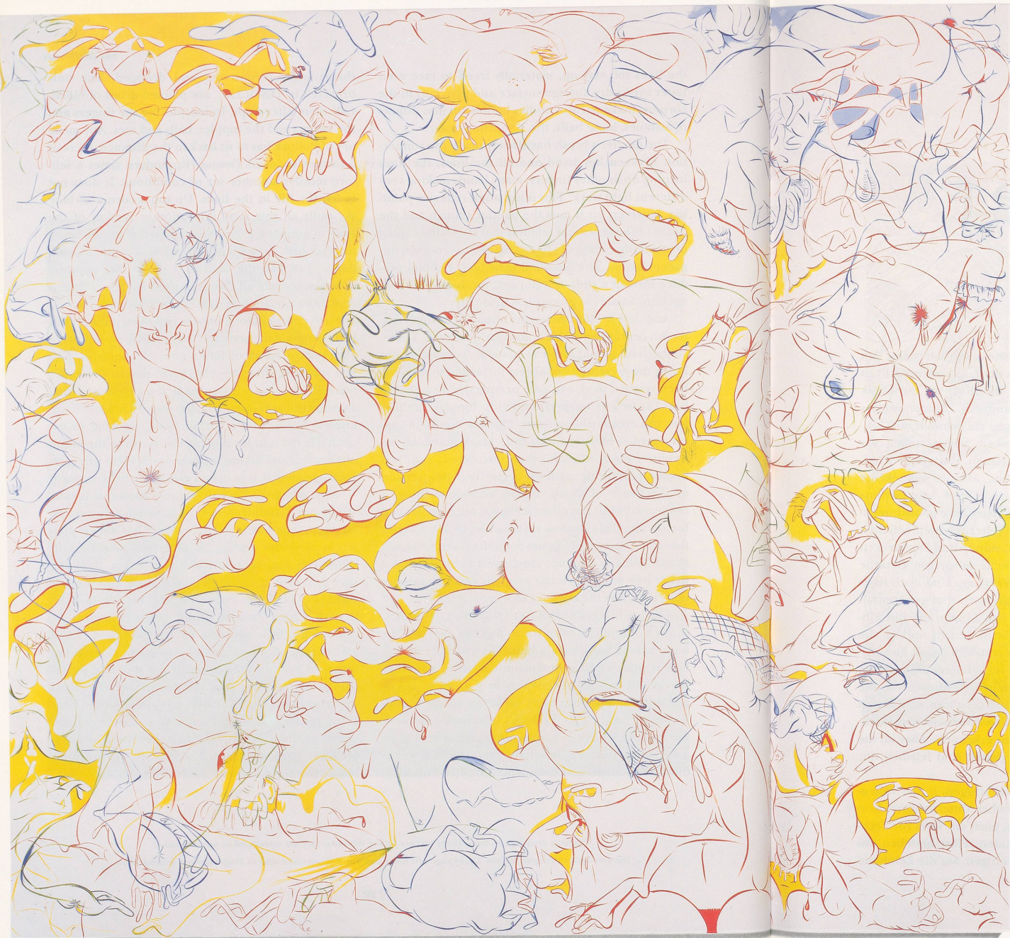
SUE WILLIAMS, TESTICLE FLANGE ON THE GREEN, 1997, oil and acrylic on canvas, 96 x 108" / HODENKLAMMER AUF DEM RASEN, Öl und Acryl auf Leinwand, 244 x 274 cm.