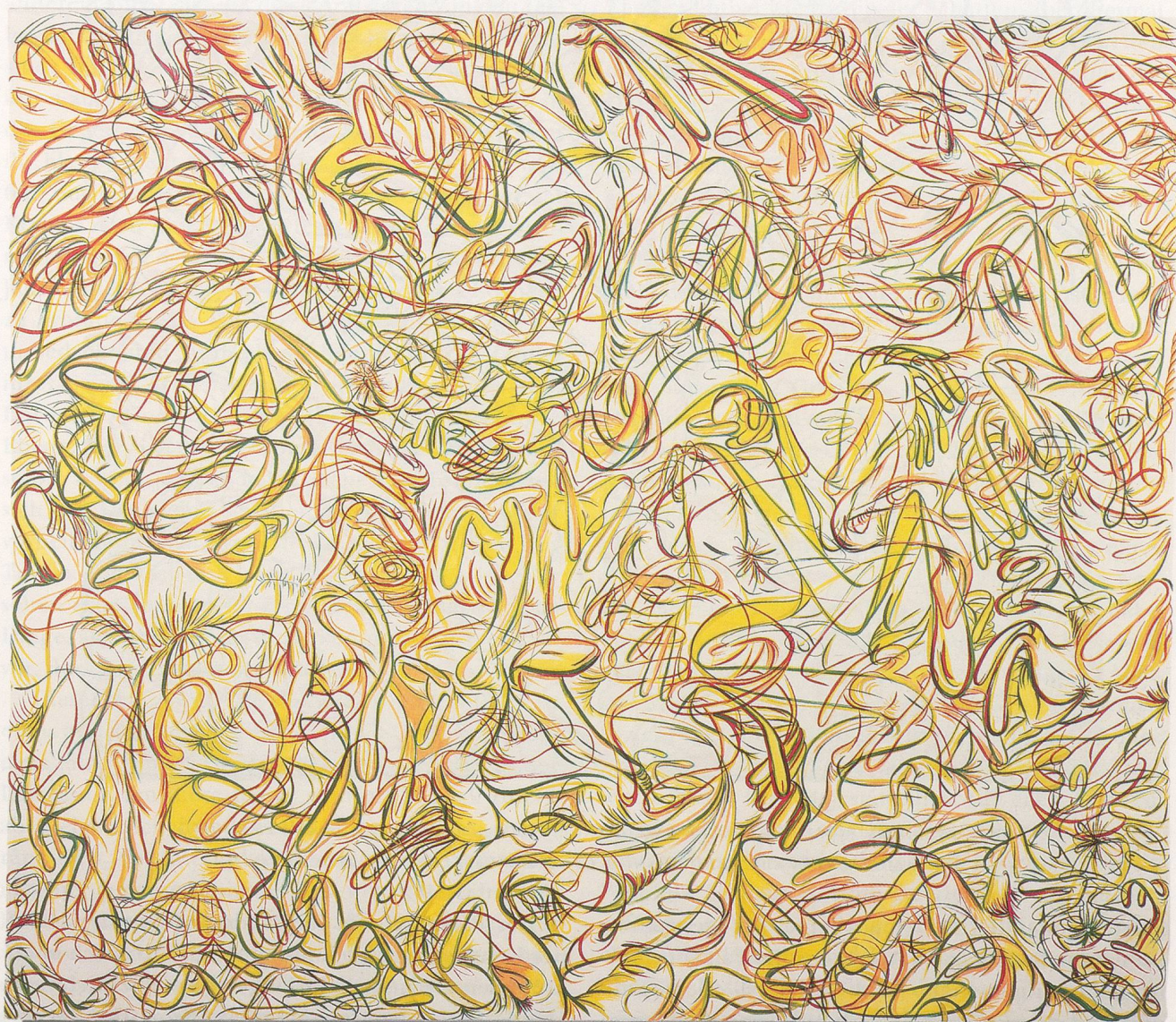
SUE WILLIAMS, APPENDAGES IN FULL BLOOM, 1997, oil and acrylic on canvas, 72 x 84" /

ANHÄNGSEL IN VOLLER BLÜTE, Öl und Acryl auf Leinwand, 183 x 213,4 cm.