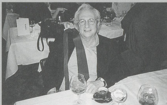
Zürich, November 1996: Frank Gehry trägt seine Sophie Calle Edition für Parkett Nr. 36 auf gekonnt dekonstruktive Art.

Frank Gehry, seen in Zurich in November 1996 wearing his Sophie Calle edition for Parkett no. 36 with virtuoso deconstructivism.