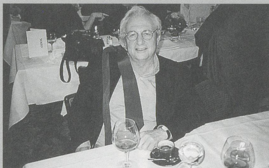
Zürich, November 1996: Frank Gehry trägt seine Sophie Calle Edition für Parkett Nr. 36 auf gekonnt dekonstruktive Art.

Frank Gehry, seen in Zurich in November 1996 wearing his Sophie Calle edition for Parkett no. 36 with virtuoso deconstructivism.