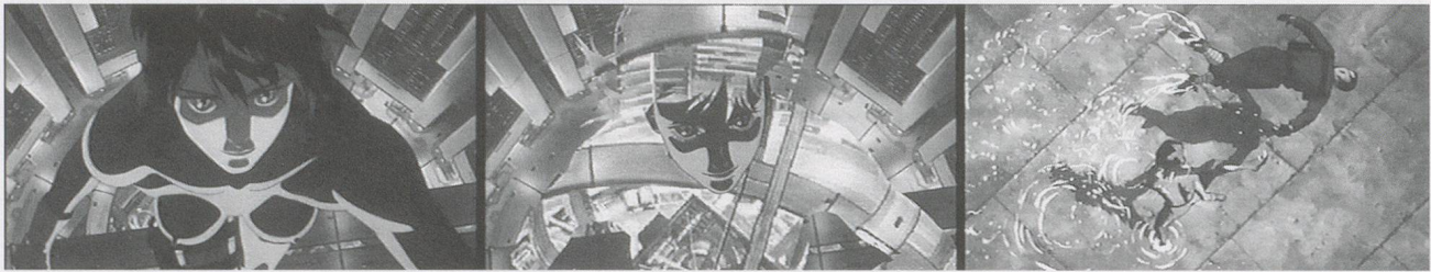
GHOST IN THE SHELL, 1995, computer animation stills.

Ghost tells the story of the replicant as detective and as that which is to be detected. Agent K, in her fully manu-