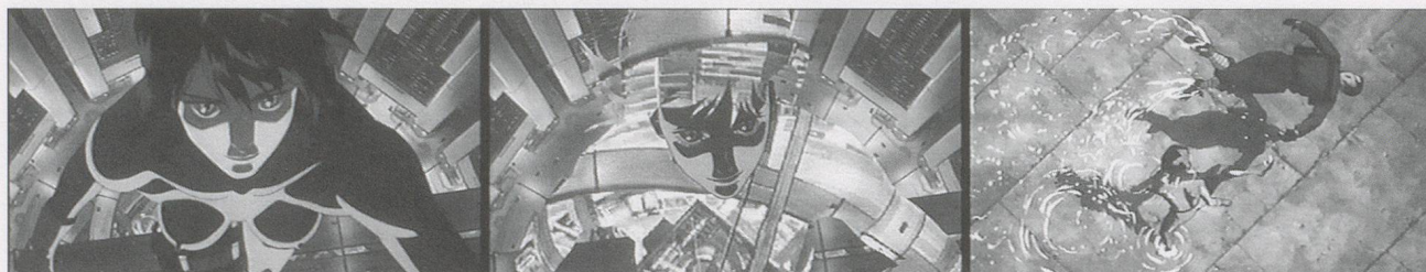
GHOST IN THE SHELL, 1995, computer animation stills.

Ghost tells the story of the replicant as detective and as that which is to be detected. Agent K, in her fully manu-