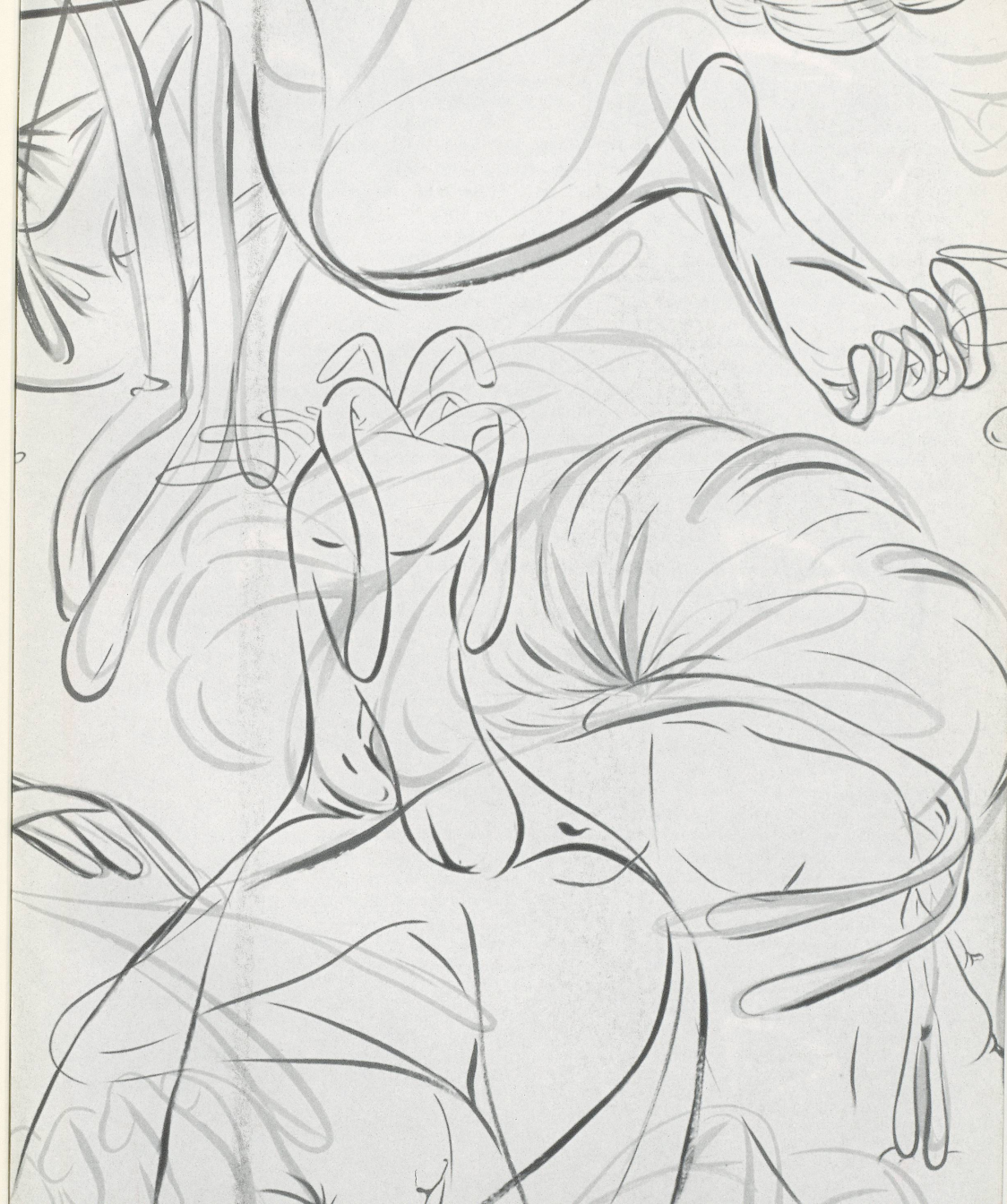
JEFF KOONS, HANGING HEART, 1995-97, original photograph for painting.