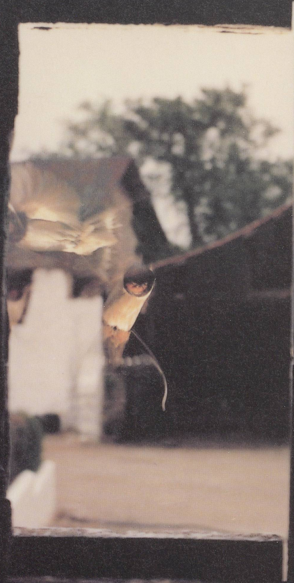
JEAN-LUC MUYLAVÉ, NO. 5 JUILLET-AOÛT 1979.