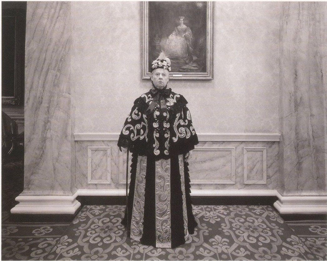
HIROSHI SUGIMOTO, QUEEN VICTORIA, 1994, Madame Tussaud's, London.