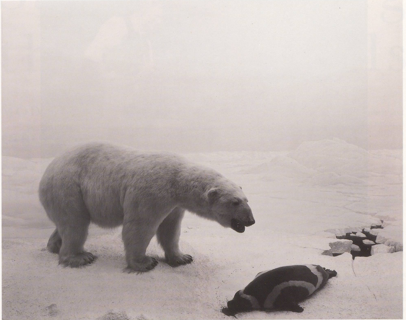
HIROSHI SUGIMOTO, POLAR BEAR, 1976 / EISBÄR, American Museum of Natural History, New York.