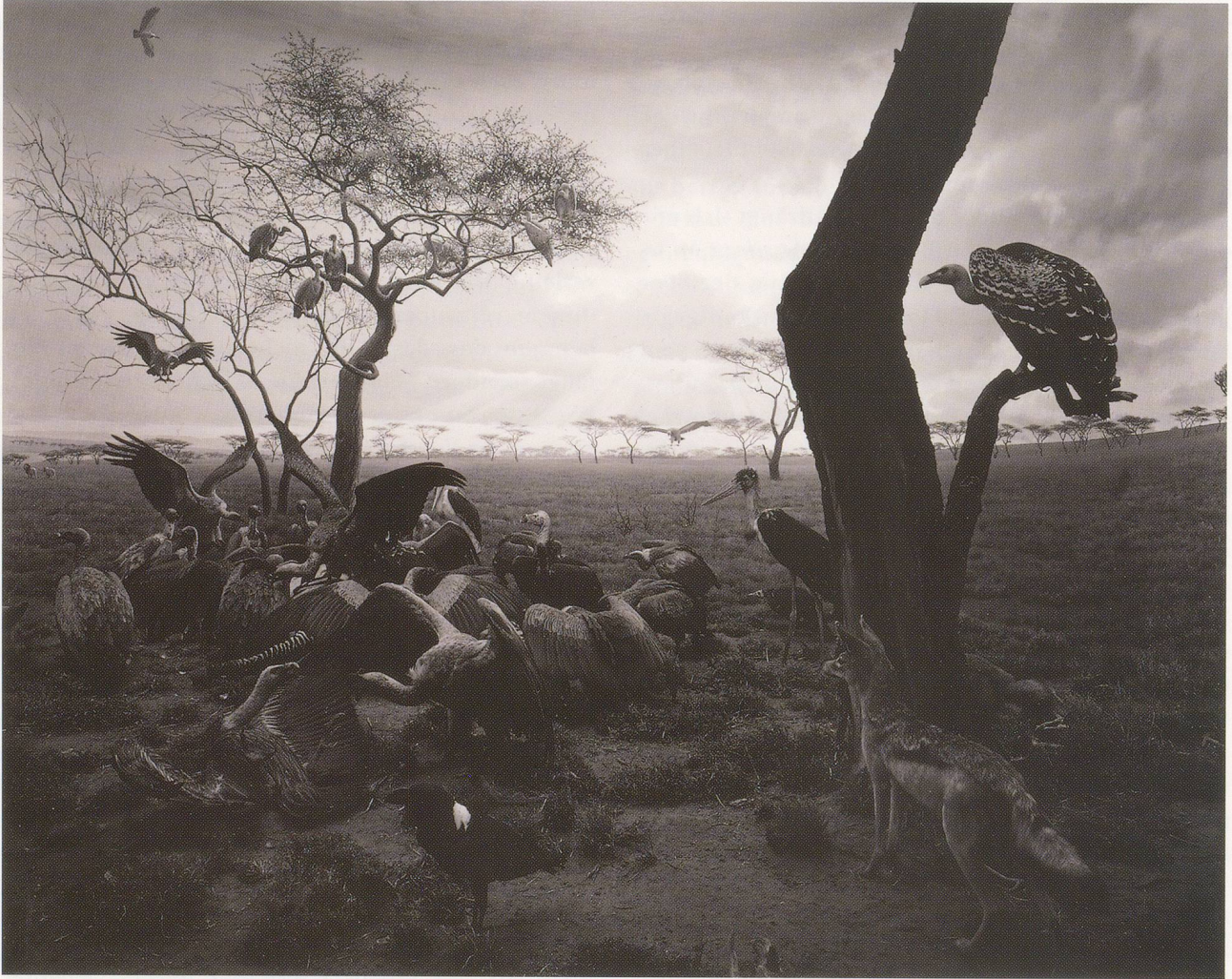
HIROSHI SUGIMOTO, HYENA, JACKAL, VULTURE, 1976 / HYÄNE, SCHAKAL, GEIER, American Museum of Natural History, New York.