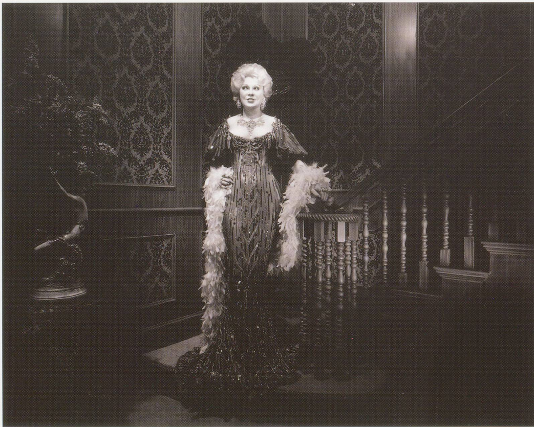
HIROSHI SUGIMOTO, MAE WEST, 1994, Movieland Wax Museum, Buena Park, California / Wachsfigurenkabinett, Buena Park, Kalifornien.

ular Sugimoto's precise compositions, which so often recall their mechanical origins, convey a sense of the photographer as a hybrid creature, part human and part machine, who thus possesses a special license to explore the boundary separating the living and the inanimate. Like the work of a metaphysical coroner, his art does not seek to bring the dead to life—as often seems to happen in memorial photography—but instead intervenes with a ghostly touch, so that each image betrays the transformative presence of a human, or half-human, witness.