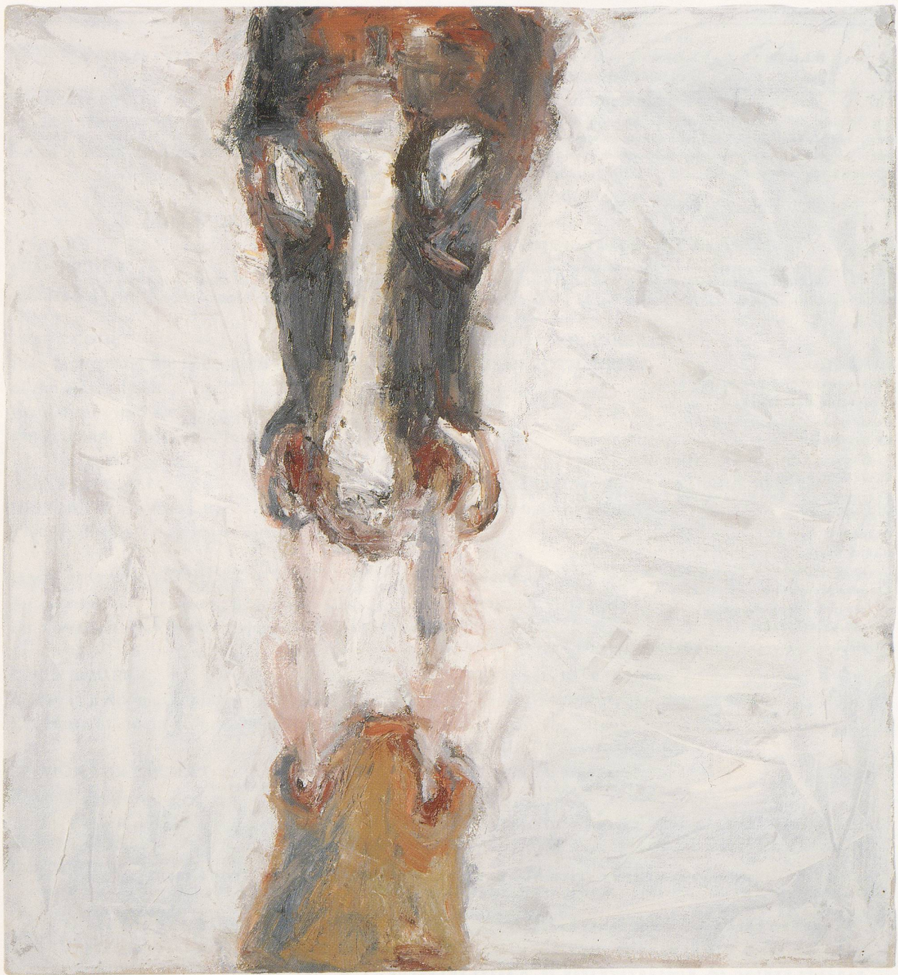
SUSAN ROTHENBERG, BREATH , 1993, oil on canvas, 27 \frac{1}{4} x 25" / ATEM , Öl auf Leinwand, 69,2 x 63,5 cm.