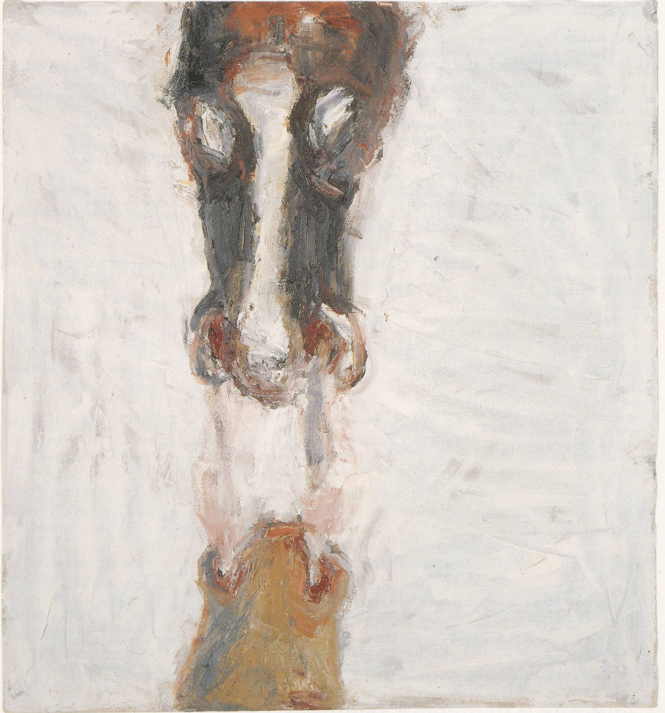
SUSAN ROTHENBERG, BREATH , 1993, oil on canvas, 27 \frac{1}{4} x 25" / ATEM , Öl auf Leinwand, 69,2 x 63,5 cm.