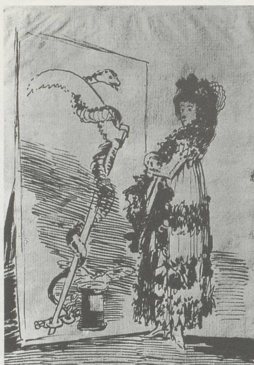
Common Sense / Gemeine Sense (Oskar Pastior)

Goya, The Indiscreet Mirror. The Serpent Woman / Der indiskrete Spiegel. Die Schlangenfrau, Prado Madrid, vgl. / see p. 118.