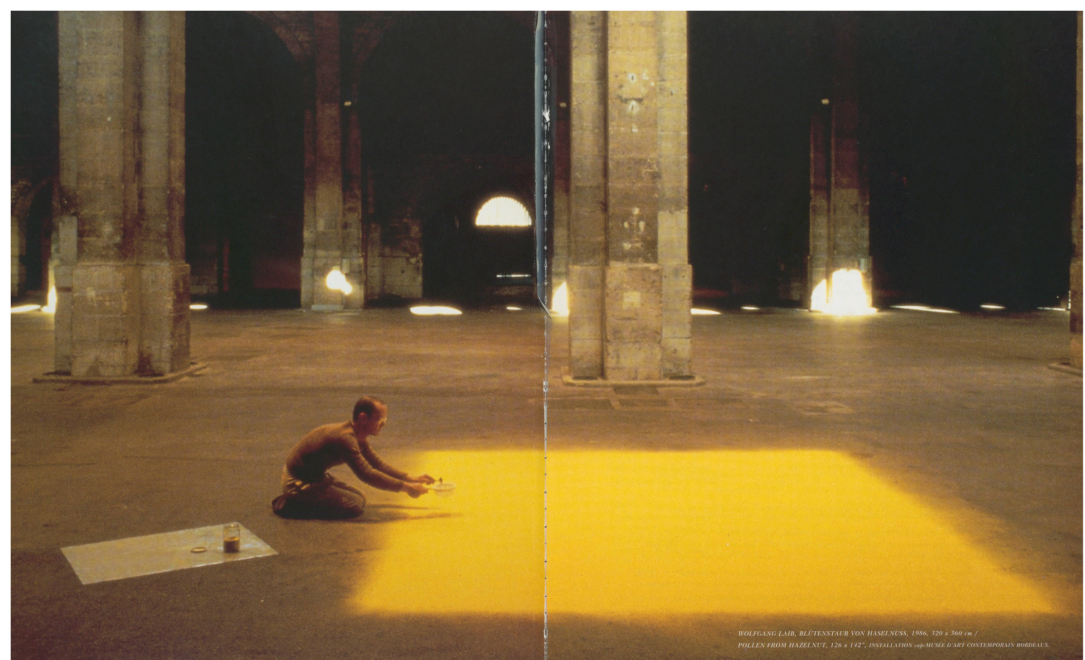
WOLFGANG LAIB, BLÜTENSTAUB VON HASELNUSS , 1986, 320 x 360 cm / POLLEN FROM HAZELNUT , 126 x 142", INSTALLATION capo MUSÉE D'ART CONTEMPORAIN BORDEAUX.