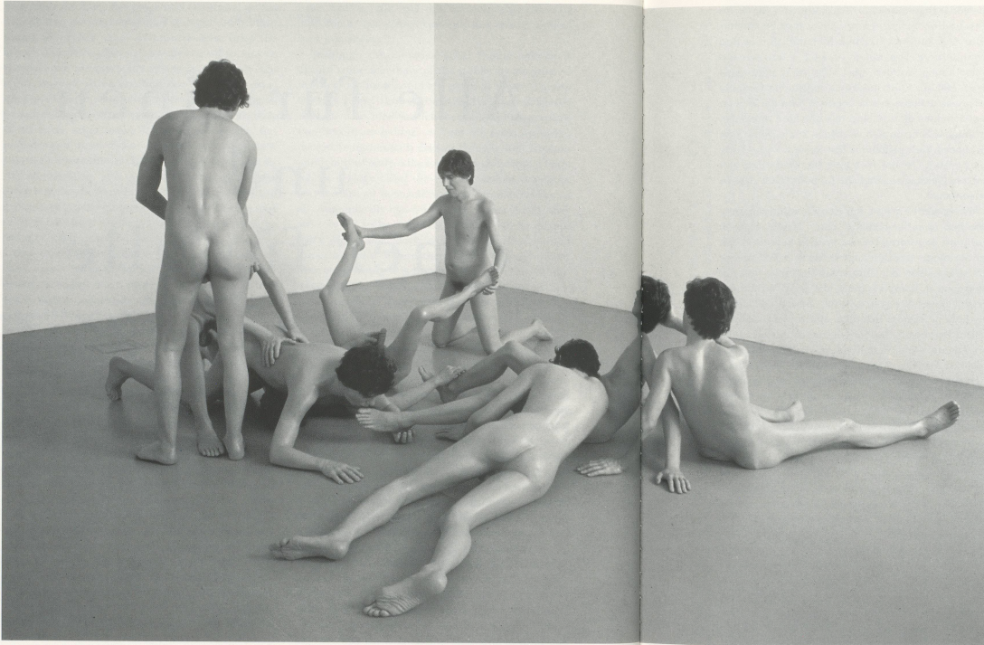
A SCULPTURE OF A SEX ORGY WITH EIGHT FIGURES ALL CAST FROM THE ARTIST'S BODY. SKULPTUR EINER SEXORGIE MIT ACHT FIGUREN, DIE ALLE NACH DEM KÖRPER DES KÜNSTLERS GEGOSSEN SIND.

OH! CHARLEY, CHARLEY, CHARLEY... 1992, mixed media, 72 x 180 x 180 / Mischtechnik, 183 x 457 x 457 cm.