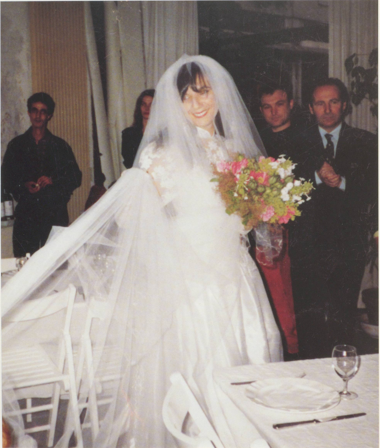
SOPHIE CALLE, WEDDING / HOCHZEIT, JUNE 20, 1992.