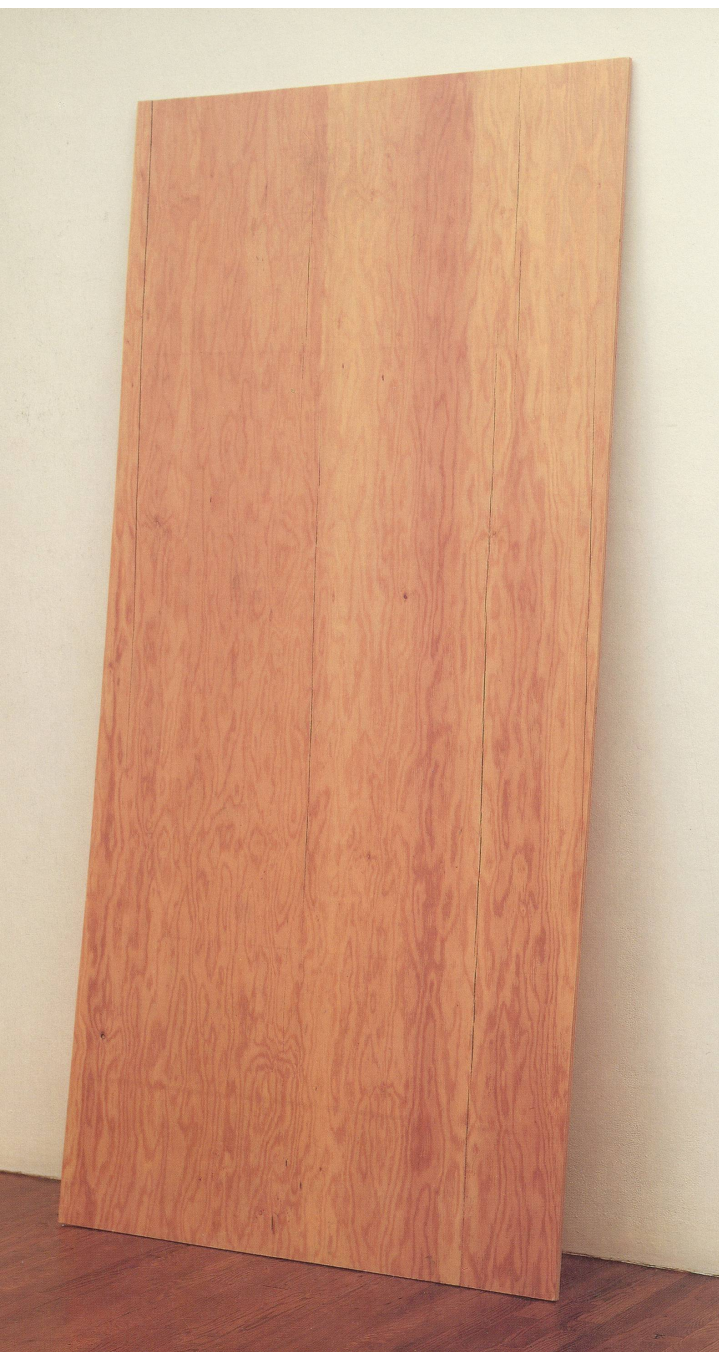
LINKS/LEFT: ROBERT GOBER, SPERRHOLZ, 1987, farnierte Tannenholz, 242 x 118 x 1,6 cm/PLYWOOD, 1987, laminated fir, 95 1/4 x 46 1/2 x 5/8". RECHTS/RIGHT: LOUISE BOURGEOIS, CELL/ZELLE, mixed media, 1991.