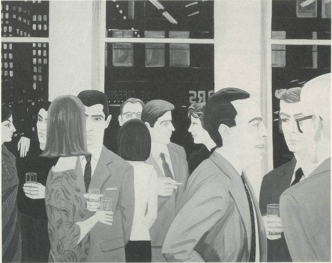
ALEX KATZ, COCKTAIL PARTY, 1965, OIL ON CANVAS/ÖL AUF LEINWAND, 78 x 96 "/ 198 x 244 cm.

UMSCHLAG / COVER: ALEX KATZ, PASSING / VORÜBERGEHEN (SELF-PORTRAIT), 1962-63, OIL ON CANVAS/ÖL AUF LEINWAND, 79 5 / 8 x 71 3 / 4 "/ 202 x 183 cm. (COLLECTION, THE MUSEUM OF MODERN ART, NEW YORK)