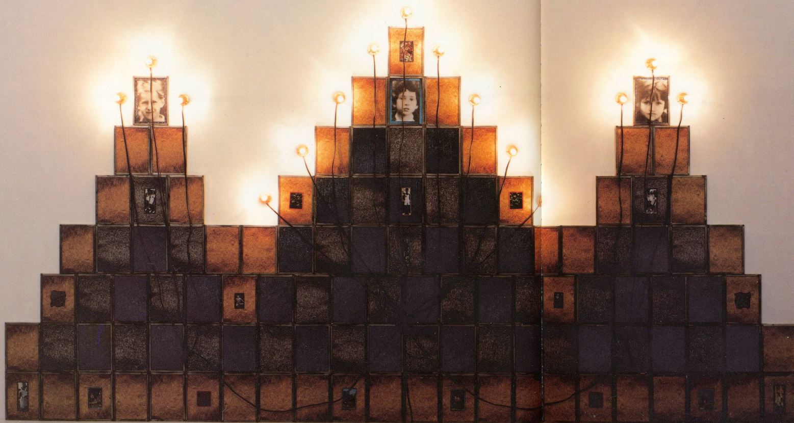
CHRISTIAN BOLTANSKI, MONUMENT, 1985, 111 BLACK-AND-WHITE AND COLOUR PHOTOGRAPHS IN TIN FRAMES WITH 15 LIGHTS / 111 SCHWARZWEISS- UND FARB-PHOTOS IN BLECHRAHMEN MIT 15 LICHTERN. 130 x 63" / 330 x 160 cm. (THE YDESSA HENDELES ART FOUNDATION, TORONTO)