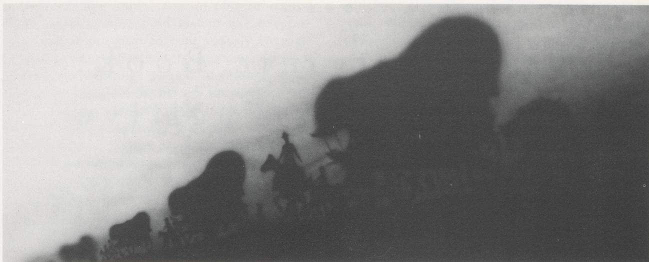
EDWARD RUSCHA, A CERTAIN TRAIL / EIN GEWISSER ZUG , 1986, ACRYLIC ON CANVAS / ACRYL AUF LEINWAND, 59 x 145 1/2" / 150 x 370 cm.