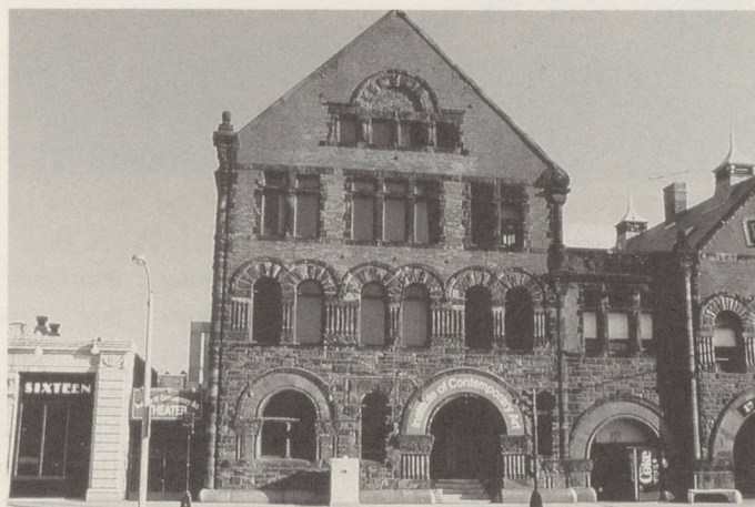
THE INSTITUTE OF CONTEMPORARY ART IN BOSTON

the museum whose project is to classify art and incorporate it into the narrative of art history. At The ICA we have chosen not to adhere strictly to museum methodology but to learn also from the gallery, the critic, and the collector.