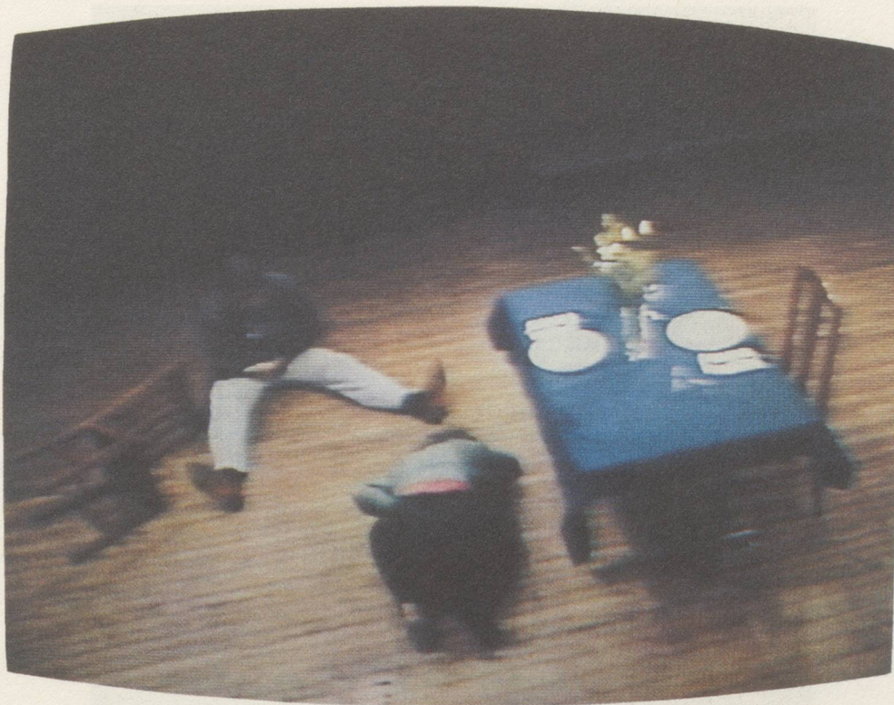
BRUCE NAUMAN, STILL FROM THE VIDEO TAPE FOR PARKETT, VIOLENT INCIDENT - MAN/WOMAN SEGMENT, 1986, 30 MIN. (TIME OF ONE SEQUENCE: 28 SEC.), COLOR, SOUND, EDITION OF 200, NUMBERED, SIGNED. (PARKETT DELUXE EDITION NO. 10)