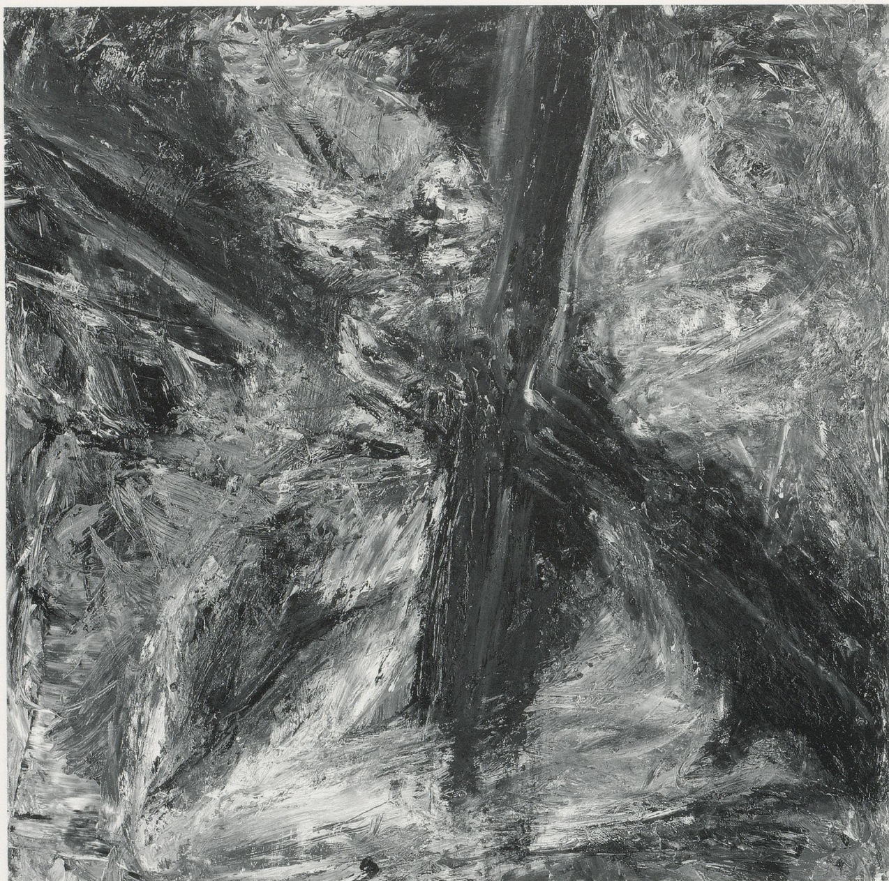
Martin Disler, IM DREHKREUZ / IN A TURNSTILE , 1984 Öl auf Leinwand / Oil on canvas , 100 x 100 cm / 39 1/3 x 39 1/3".

Vorderseite / preceding page : Martin Disler, 1984.