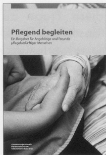
Pflegend begleiten Zürich: Careum Verlag, 2010

Dieser Ratgeber für Angehörige und Freunde pflegebedürftiger Menschen ist vom Careum Verlag in Kooperation mit Pro Senectute und dem Schweizerischen Roten Kreuz neu aufgelegt worden. Er will dazu anregen, sich Gedanken zu machen darüber, was es bedeutet, eine Begleitung oder Pflege zu übernehmen, Entlastungs- und Unterstützungsmöglichkeiten kennen zu lernen und die Aktivitäten der betreuten Menschen hilfreich zu unterstützen. Es werden Fragen und Probleme angesprochen, die in vielen Begleitsituationen in ähnlicher Weise auftauchen, wie z.B. Unterstützung beim Aufstehen, bei der Körperpflege und der Ausscheidung, im Umgang mit Hör- oder Sehproblemen und dem Sterben.