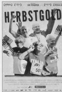
Herbstgold Ein Film von Jan Tenhaven Good!Movies, 2010

sam überhand.» Zwischendurch flammt auch Zuversicht auf: «Hie und da aber grüsst – o Wunder! – ein ewiger Augenblick die heilige, weil von Gott gewollte Vergänglichkeit.»