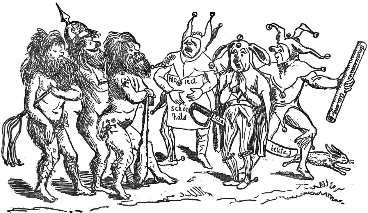
Die Barbaren stehen vor den Thoren.

Schweiz. Nationalzeitung vom 1. April 1850.