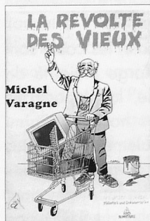
Varagne, Michel La révolte des vieux Sury en Vaux : AàZ, 2007

Cet ouvrage, liste les problématiques liées au maintien à domicile des personnes âgées. Il présente ensuite des réponses apportées par les nouvelles technologies pour favoriser et préserver leur autonomie. L'intérêt de cet ouvrage repose sur une approche complète de la mobilité des seniors dans et autour de leur lieu de vie. Sont rassemblés ici des points de vue techniques et scientifiques, des apports sociologiques, psychologiques et éthiques, ainsi que des témoignages et de nombreux exemples illustrés de solutions apportées par les gérontechnologies.