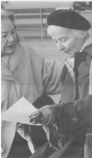
Les femmes ont besoin de contacts sociaux ...

Au cours du XXème siècle, l'espérance de vie moyenne a progressé de 30 ans dans notre pays. Ce prolongement de la vie signifie