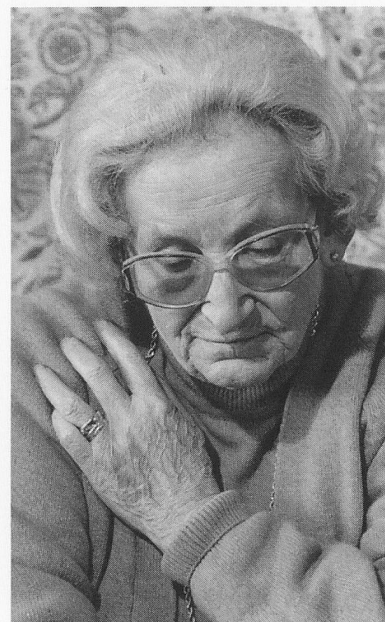
L'argent suffira-t-il à couvrir mes frais de pension ?