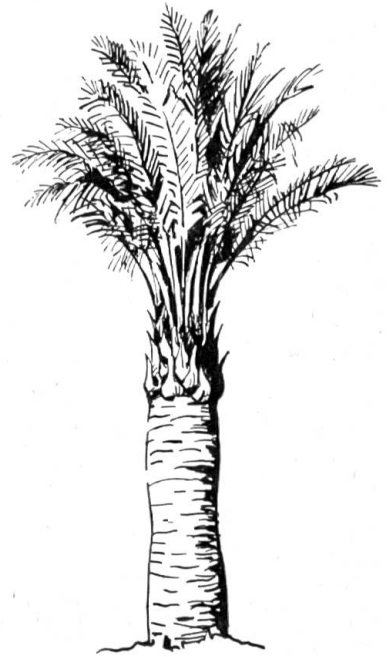
Typus der „Federpalmen“

Zum Schluß seien noch die zwei schönsten Federpalmen dieser Zone genannt. Im tiefen Urwald findet sich neben der bereits erwähnten Motacúpalme eine glatte kerzengerade schlanke Palme, die leicht 15 m erreicht, mit herrlicher regelmäßiger saftgrüner Krone, aus der bald hellgelbe Blütenrispen, bald orangengelbe Fruchtrauben hervorragen. Sumuquépalme ist ihr Name, vom Botaniker Cocus Botriophora genannt. Sie hat viel Ähnlichkeit mit der großen Chontapalme, mit dem einen Unterschied, daß die Sumuquépalme keine Stacheln hat. Aber es mag auch Kreuzungen geben. Die Blätter erreichen eine Länge von 1 bis 2 m, wenn sie abfallen, lassen sie keine Narben zurück, so daß der Stamm glatt bleibt. Aus den Fasern der zarten Blatttriebe (Cogollo) werden auch Hüte geflochten; die Frucht ist