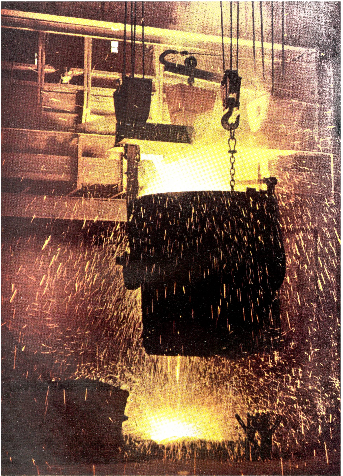
ie Herstellung hochwertiger Spezialstähle erfordert besondere Zusätze beim Schmelzprozeß, noch ehe sich der flüssige Stahl funkensprühend in die riesige Pfanne ergießt