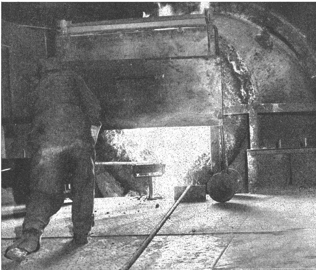
Alle 15 Minuten wird dieser große „Konverter“ entleert, in dem die Aufbereitung des Eisens zu Stahl erfolgt

so sehen wir links vom Wasserstoff die Metalle mit positivem, also edlem und rechts die mit negativem, also unedlem Potential. Die Messung des Potentials ist bei manchen Elementen, wie z. B. Cr und Al mit großen Schwierigkeiten verbunden, da diese beiden Metalle bereits bei Berührung mit Luft in den sogenannten „passiven“ Zustand übergehen, d. h. sich ähnlich wie ein Edelmetall verhalten und auch in diesem Zustand nicht ihr wahres, unedles Potential zeigen, sondern ein über dem Wasserstoff liegendes, edles Potential erkennen lassen. Eisen zeigt ein ähnliches Verhalten nur dann, wenn man es in konzentrierte Salpetersäure taucht. Durch bloßes Liegen an der Luft wird Eisen nicht passiv, sondern beginnt, sich je nach dem Feuchtigkeits- und Reinheitsgrad der Luft mehr oder weniger schnell mit Rost zu überziehen. Es muß jedoch erwähnt werden, daß die durch Salpetersäure erzeugte „Passivität“ des Eisens beim Liegen an der Luft nicht beständig ist, bald wieder verlorengeht,