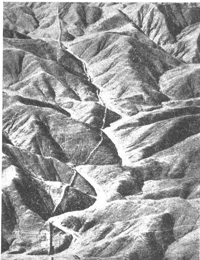
Die Große Mauer von Peru erstreckt sich von der Gegend um Lima im Süden bis etwa zum Colco-Fluß im Norden, der zum Stromgebiet des Rio-Sante gehört.

Gegen die erobernden Inka haben sich die alten Reiche durch Erbauung großer Mauern zu schützen gesucht, deren Reste nun hier und da entdeckt werden. Die gewaltigste von ihnen ist die offenbar von den Tschimu im 14. bis 15. Jahrhundert erbaute Große Mauer. Sie beginnt an der Küste im Tale des Rio Santa und reicht bis in die Gegend von Lima. Denn sie war eine Zeitlang die Grenze zwischen dem Inka-reich im Osten und dem Reich der Tschimu im Westen. Diese Mauer zieht — ein Gegenstück zur Chinesischen, und wie diese — über Berg und Tal hinauf und hinab. Sie ist in regelmäßigen Intervallen unterbrochen oder verstärkt durch meist rechteckige, aber auch runde Festungsanlagen; diese liegen so auf Gipfeln und Kämmen, daß sie vom Tale aus nicht sichtbar sind. Das stärkste dieser Forts ist 100 m lang und 60 m breit. Die Mauern der Befestigungen sind sehr stark, gleichwohl nur aus gebranntem Lehm erbaut. Dieses gewaltige Befestigungssystem war bisher unbekannt; erst amerikanische Flieger haben es entdeckt und zunächst etwa 50 km davon photographiert. Inzwischen dürfte die genaue Länge der Mauer festgestellt worden sein. Sie hat den Untergang der Kultur und des Reiches der Tschimu, eigentlich deren Einverleibung und Aufsaugung durch die Inka, nur aufhalten, jedoch nicht verhindern können.