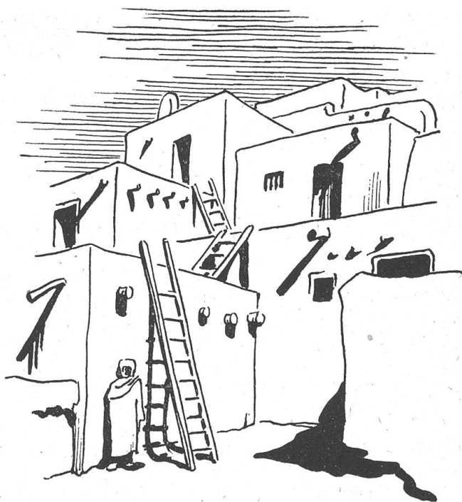
Am Fuße des Sangre de Christo liegen die altertümlichen, terrassenförmigen Wohnstätten der Indianer Taos pueblo

liegende Taos pueblo — offiziell San Geronimo de Taos —, das indianische Siedlungsviertel, dessen Annalen bis 1540 zurückgehen. Hier, unweit der amerikanischen Stadt, spielt sich das Leben der Indianer in ihren primitiven Wohnstätten fast genau so ab wie zur Zeit, als die ersten spanischen Entdecker vor 400 Jahren ins Land kamen. Namen wie Cortez, Romero, Pena und Gonzales finden sich bei den Taosenos, die voll Stolz ihre Ahnen viele Generationen zurückverfolgen. Taos pueblo wird durch einen kleinen Wasserlauf, aus dem die Einwohner das Wasser mit Kübeln schöpfen, in zwei Teile getrennt. Ursprünglich wurden alle Siedlungsbauten, von denen einige 4 bis 5 Stockwerke hoch sind, als Festungen errichtet und hatten nur in den Dächern Öffnungen. Inzwischen wurden zwar durch die dicken Mauern Türen und Fenster gebrochen, doch sind die oberen Wohnräume noch immer nur mit Leitern zu erreichen.