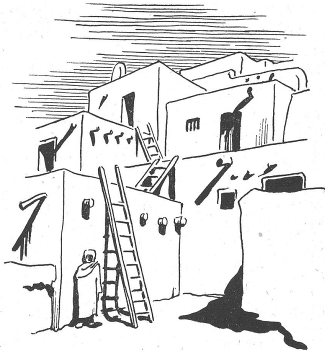
Am Fuße des Sangre de Christo liegen die altertümlichen, terrassenförmigen Wohnstätten der Indianer Taos pueblo

Taos besteht eigentlich aus drei Teilen: Dem eigentlichen Taos — offiziell Don Fernando de Taos —, das ungefähr 1600 von spanischen Kolonisten angelegt wurde und größtenteils von Familien spanischer Abkunft bewohnt wird; daneben liegt Ranchos de Taos, ursprünglich Sommeraufenthalt für jene Farmer, die ihre Gründe in dem angrenzenden Tal hatten, und das durch seine alte Missionskirche berühmt wurde, sowie das eine Meile entfernt