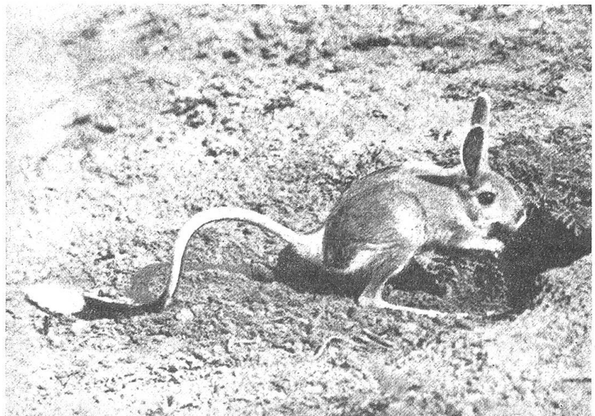
Die zierlichen Tierchen wittern während der Nahrungssuche in aufrechter Haltung nach allen Seiten

So treiben die Pferdespringer ihr heimliches Wesen in den unwirtlichen Steppengebieten, und wenn nicht die Mongolen und andere Steppenvölker ihren Braten schätzten, wären es Tiere ohne besondere Bedeutung für den Menschen. Doch hat die Wissenschaft in Mitteldeutschland fossile Reste von Pferdespringern nachweisen können: ein Beweis, daß in der letzten Periode nach der Eiszeit bei uns kontinentales Steppenklima herrschte mit langen kalten Wintern und kurzen heißen Sommern. Erst später wichen jene typischen Steppentiere dem feuchter werdenden Klima eines sich wieder bewaldenden Landes. Bodenforschungen haben auch ergeben, daß die Pferdespringer nicht etwa bloß Pflanzen wegfressen, sondern im Gegenteil gerade auch den Grünwuchs fördern: zu Tausenden und Abertausenden schleppen sie beim Anlegen ihrer Bauten fruchtbare schwarze Erde an die Oberfläche, so daß unmittelbar neben einem solchen Bau gerade erhöhter Pflanzenwuchs zustande kommt. Diese modernste Betrachtung der Beziehungen zwischen Tierwelt, Pflanzenwelt und Landschaft hat schon