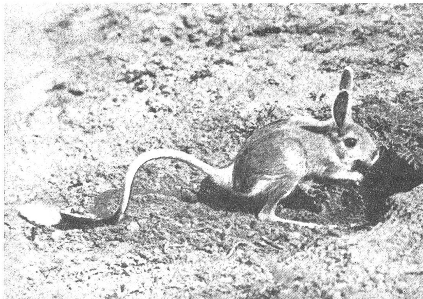
Die zierlichen Tierchen wittern während der Nahrungssuche in aufrechter Haltung nach allen Seiten

So treiben die Pferdespringer ihr heimliches Wesen in den unwirtlichen Steppengebieten, und wenn nicht die Mongolen und andere Steppenvölker ihren Braten schätzten, wären es Tiere ohne besondere Bedeutung für den Menschen. Doch hat die Wissenschaft in Mitteleuropa fossile Reste von Pferdespringern nachweisen können: ein Beweis, daß in der letzten Periode nach der Eiszeit bei uns kontinentales Steppenklima herrschte mit langen kalten Wintern und kurzen heißen Sommern. Erst später wichen jene typischen Steppentiere dem feuchter werdenden Klima eines sich wieder bewaldenden Landes. Bodenforschungen haben auch ergeben, daß die Pferdespringer nicht etwa bloß Pflanzen wegfressen, sondern im Gegenteil gerade auch den Grünwuchs fördern: zu Tausenden und Abertausenden schleppen sie beim Anlegen ihrer Bauten fruchtbare schwarze Erde an die Oberfläche, so daß unmittelbar neben einem solchen Bau gerade erhöhter Pflanzenwuchszustand kommt. Diese modernste Betrachtung der Beziehungen zwischen Tierwelt, Pflanzenwelt und Landschaft hat schon