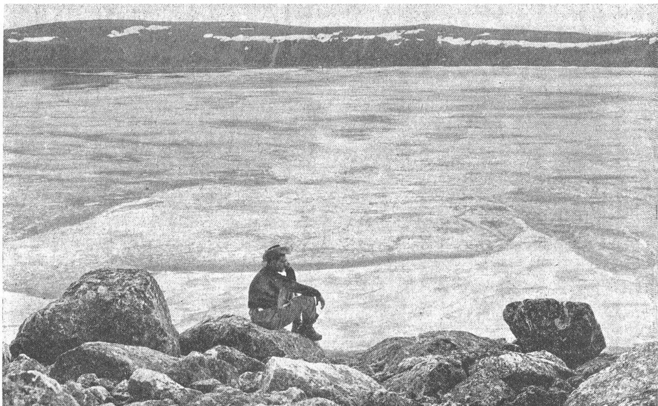
Abb. 2. In der weiten Felstundra des Gebietes von Ungava, im Nordteil der Provinz Quebec auf der Labradorhalbinsel südlich von Baffinland, ereignete sich die gewaltige Naturkatastrophe. Um den See ist heute ein Wall von Granitfelsblöcken aufgetürmt, der eine durchschnittliche Höhe von 180 m aufweist

Meilen ging der Flug von Toronto, bis der geheimnisvolle See in Sicht kam (Abb. 1). Die Expeditionsteilnehmer sahen die ursprüngliche Vermutung bestätigt. Es handelte sich um einen riesigen Meteorkrater von etwa 11,2 km Umfang und einem Durchmesser von 3,6 km. Der Meteor hatte sich etwa 20 m tief in den Granit eingeholet und einen Ringwall aus Felsblöcken von 180 m Höhe aufgetürmt. Der den Krater erfüllende See war zur Zeit der Expedition (Ende Juli 1950) mit einer etwa 1 m dicken Eisschicht bedeckt und zeigte nur längs des Ufers einige offene Stellen (Abb. 2). Damit waren diese Meteorspuren die größten, die bisher entdeckt wurden, denn der Durchmesser des Teufelskraters in Arizona beträgt nur 1300 m und der vor drei Jahren in West-Australien entdeckte Wolf-Creek-Krater bloß 800 m.