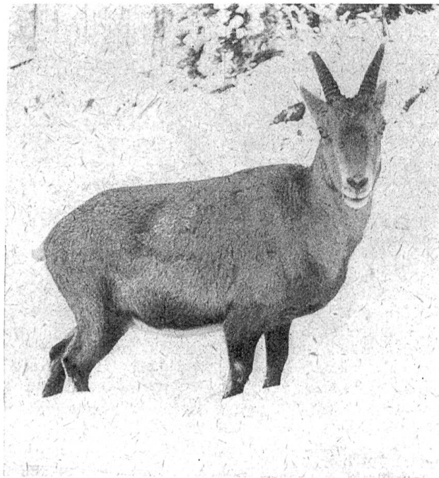
Steingeiß im fahlgrauen Winterkleid. Die Haare stehen so dicht, daß der Schnee oft auf ihnen liegt bleibt

Erlegung eines Steinbockes mit einer Geldbuße von fünfzig Kronen bestraft und zwanzig Jahre später wurden sogar Körperstrafen festgesetzt. Aber selbst dies konnte das Wildern nicht verhindern, denn die Preise, die für den Bezoarstein oder das Herzkreuz eines Steinbockes gezahlt wurden, waren hoch und stiegen, je seltener die Wundermittel, denen man Jahrhunderte hindurch geradezu zauberische Kräfte zuschrieb, in den Handel kamen. So konnte sich das edle Tier, weil sein wirksamer Schutz in den schwer zugänglichen und daher kaum oder gar nicht zu überwachenden Regionen des Hochgebirges fast unmöglich war, nur da halten, wo es dem Menschen nicht mehr gelang, hinzukommen. Schon vor hundert Jahren mußte sich, wie Tschudi in seinem klassi-