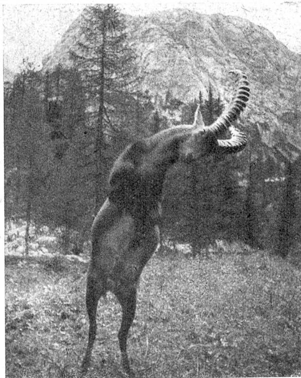
Alter Steinbock greift an. Steinböcke schlagen von oben mit ihrem ganzen Körpergewicht auf ihren Gegner ein

von Hausziegen hatten aber eine dem natürlichen Jahreszyklus nicht angepaßte Setzzeit, und so gingen die meisten Kitze infolge der Witterungsungunst zugrunde. Zudem wurde keine „Verdrängungszucht“ betrieben, bei der immer nur reinrassige Böcke zur Nachzucht zugelassen werden dürfen, sondern man benutzte dazu auch Nachkommen der Kreuzungsgeißen. Der ganze Bestand schien somit wertlos geworden zu sein und wurde im Jahre 1901 nach der Javoriner Tatra überführt; im Jahre 1940 sahen die übriggebliebenen Tiere wilden Bezoarziegen ähnlicher als Steinböcken. Auch die ersten im Blühnbachtal des Hagengebirges durchgeführten Aussetzungsversuche scheiterten an den gleichen ungeeigneten Maßnahmen wie im Tennengebirge. Erst im Jahre 1920 hatte man hier Erfolg, nachdem man reinrassiges Steinwild aussetzte und sich