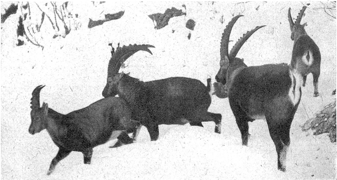
Steinböckrudel. Außerhalb der Brunftzeit stehen die Böcke ohne Geißen zusammen

Das seltenste Hochgebirgswild der Alpen ist das Steinwild oder, wie man es auch schon früher genannt hat, das Fahlwild. Einstmals in beachtlicher Zahl über die Hochalpengebiete verbreitet, ist es heute fast allenthalben verschwunden, weil es infolge der ständigen Ausweitung der Hochalmenwirtschaft seine besten Standorte verlor und wegen der als Wundermedizin hoch geschätzten „Bezoarsteine“ und „Herzkreuze“ unerbittlich vom Menschen verfolgt wurde. Unter einem Bezoarstein versteht man eine Zusammenballung von Haaren, die durch Lecken und Verschlucken in den Magen geraten. Dort werden sie mit Harz, das beim Äsen der Latschenkiefern aufgenommen wird, „verkittet“, und durch Verdauungsbewegungen zu einer zwei bis drei Zentimeter starken Kugel geformt. Das Herzkreuz wird von verknöcherten Sehnen der Herzmuskeln gebildet, die gewisse Ähnlichkeit mit einem Kreuz aufweisen.