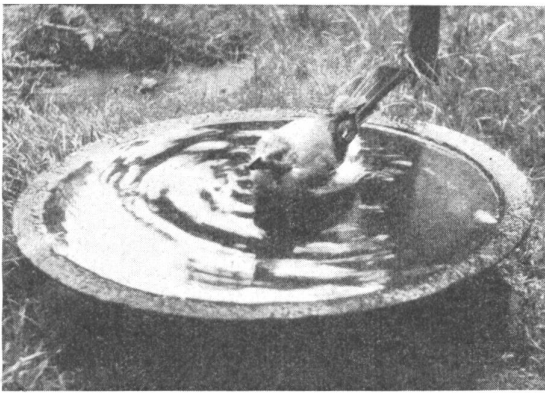
Bild 4: Auch der Eichelhäher macht von der günstigen Badegelegenheit Gebrauch.

größeren Vögel verspritzen einen ansehnlichen Teil davon, wenn sie beim Baden mit den Flügeln schlagen, so daß das Gras in der Nähe des Beckens immer naß ist. Fröhlichmorgens wird immer mit abgestandenem Wasser nachgefüllt und an heißen Tagen muß das Wasser vier- oder fünfmal ergänzt