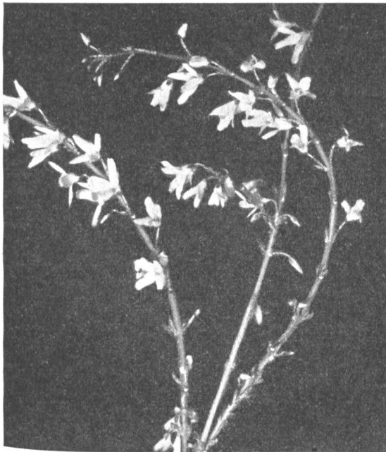
Bild 2: Schon 14 Tage nach dem Einstellen erfreuen uns die Goldglöckchen ( Forsythia ) mit ihrem Blütenschmuck.

bevor es richtig kalt gewesen ist, so hat man fast keinen Erfolg. Es scheint, als ob eine Kälteperiode nötig sei, um die Bereitschaft zum Austreiben herbeizuführen. Sehr lehrreich ist in dieser Hinsicht folgender Versuch: Man schneidet vom gleichen Strauch jede Woche wieder einen Zweig ab und behandelt alle gleich. Die ersten reagieren überhaupt nicht, sobald aber der kritische Zeitpunkt überschritten ist, wachsen sie aus. Eine mehrere Tage dauernde Kältebehandlung im Eisschrank hat auf einzelne Zweige die gleiche Wirkung, wie wenn sie noch zwei Monate im Freien geblieben wären. Man kann also in diesem Fall Zeit durch Kälte ersetzen.