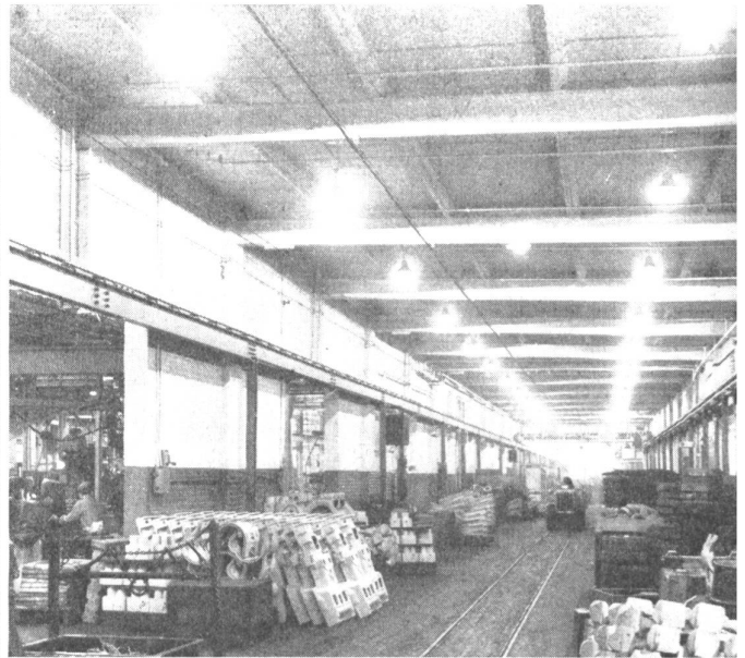
Bild 1a links: Blick in die Caterpillar-Traktoren-Fabrik vor der Einführung von „Color Engineering“. Die schmutziggraue, monotone Umgebung erschwert die Sicht, ist die Quelle von Unfällen und setzt die Leistung der Arbeiter herab. Bild 1b rechts: Blick in dieselbe Fabrik nach der Einführung von „Color Engineering.“ Ohne Änderung der Beleuchtung ist durch die Wahl reflektierender Anstriche die Sicht wesentlich verbessert und eine freundlichere Arbeitsstätte geschaffen worden, in der die Gefahr von Unfällen wesentlich geringer ist. Gleichzeitig ist die Produktivität dieser Werkstatt beträchtlich gesteigert worden.