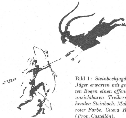
Bild 1: Steinbockjagd. Zwei Jäger erwarten mit gespannten Bogen einen offenbar vor unsichtbaren Treibern fliehenden Steinbock. Malerei in roter Farbe, Cueva Remigia (Prov. Castellón).

Mühsam schleppt sich unser Autocar auf der vom Meere gegen Ares del Maestre führenden Straße durch die bergige Maquis-Landschaft der Provinz Castellón. Weit und breit sieht man nichts als niedriges Buschwerk und felsige Hügelzüge. Von ein paar Häusern aus führt ein steiler