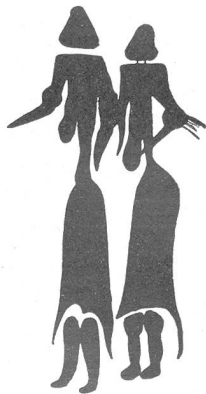
Bild 4: Mit Röcken bekleidete Frauen (Ausschnitt aus dem sogenannten Weibertanz). Malerei in schwarzer Farbe, Cogul (Prov. Lerida).

zum Beispiel in der Valltorta-Schlucht und in ganz Ostspanien, von Barcelona bis Malaga, bekannt. Die Felsbilder dieser Gebiete sind von wesentlich anderem Charakter als diejenigen der franko-kantabrischen Eiszeitkunst (siehe Prisma Nr. 8, 2. Jahrgang «Eiszeitkunst»). Die wichtigsten Unterschiede bestehen darin, daß in der Levantekunst Menschen dargestellt und daß zugleich Menschen und Tiere szenisch miteinander verbunden werden; in der franko-kantabrischen Kunst wird ja die Abbildung des Menschen vermieden, und die Tiere werden meistens einzeln wiedergegeben. Auch finden sich die Felsbilder der Levantekunst nicht in tiefen Höhlen, sondern, da diese in Ostspanien fehlen, an mehr oder weniger stark überhängenden Felswänden. Die Farben sind weniger mannigfaltig, meist wurde Rot verwendet, dann und wann kommt Schwarz vor, ganz selten Weiß. Gravierungen bilden eine Ausnahme. Deutlich zu erkennen ist, daß die prähistorischen Künstler sich zuerst in unbeholfenen, rein linearen Zeichnungen versuchten, denen Bilder mit einfarbiger Flächenfärbung oder innerer Streifenfüllung und schließlich – viel seltener – vielfarbige Maleereien folgten. Die Kunstwerke sind durchschnittlich kaum größer als eine Hand. Während die Tierdarstellungen meist in naturalistischer Auffassung wiedergegeben wurden, haben die Künstler bei der Menschendarstellung oft einen «expressionistischen» Stil angewandt. Auf eine naturgetreue Wiedergabe wurde teil-