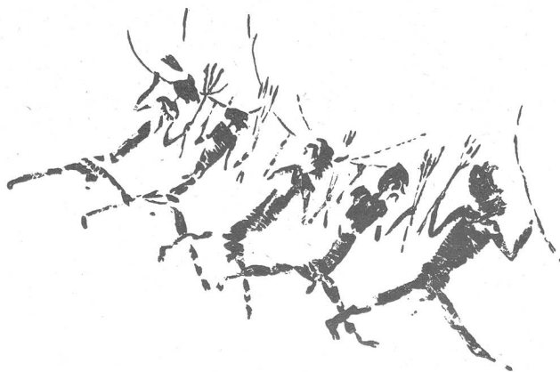
Bild 2: «Kriegerzug», bestehend aus vier zum Teil bärtigen (?) Männern und ihrem Anführer. Dieser zeichnet sich durch einen größeren Kopfputz aus und unterscheidet sich auch dadurch, daß er seinen Bogen in der linken, die Pfeile in der rechten Hand hält, während die übrigen ihre Waffen umgekehrt tragen. Malerei in grauschwarzer Farbe, Cueva Remigia (Prov. Castellón).

Der Barranco de Gasulla mit seinen verschiedenen bemalten Felsnischen ist eine der wichtigsten Fundstellen der sogenannten Levantekunst. Weitere Malereien dieser Art sind in der Nähe,