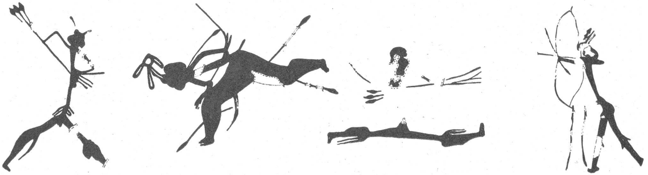
Bild 3: Von links nach rechts: Jäger mit Bogen und Pfeilen, Kopfschmuck und Kniebändern. Fliehender Krieger, der von Pfeilen getroffen zusammenbricht und im Stürzen seinen Kopfputz verliert (sein rascher Lauf wird auch durch die unverhältnismäßige Dicke der Beine zum Ausdruck gebracht). Rennender Jäger; Bogenschütze mit Kopfputz und Kniebändern im Anstand mit einem Ersatzpfeil in der Hand und zwei weiteren vor sich am Boden. Malereien in roter Farbe, Valltorta-Schlucht, Saltadora-Nischen (Prov. Castellón).

zum Beispiel in der Valltorta-Schlucht und in ganz Ostspanien, von Barcelona bis Malaga, bekannt. Die Felsbilder dieser Gebiete sind von wesentlich anderem Charakter als diejenigen der franko-kantabrischen Eiszeitkunst (siehe Prisma Nr. 8, 2. Jahrgang «Eiszeitkunst»). Die wichtigsten Unterschiede bestehen darin, daß in der Levantekunst Menschen dargestellt und daß zugleich Menschen und Tiere szenisch miteinander verbunden werden; in der franko-kantabrischen Kunst wird ja die Abbildung des Menschen vermieden, und die Tiere werden meistens einzeln wiedergegeben. Auch finden sich die Felsbilder der Levantekunst nicht in tiefen Höhlen, sondern, da diese in Ostspanien fehlen, an mehr oder weniger stark überhängenden Felswänden. Die Farben sind weniger mannigfaltig, meist wurde Rot verwendet, dann und wann kommt Schwarz vor, ganz selten Weiß. Gravierungen bilden eine Ausnahme. Deutlich zu erkennen ist, daß die prähistorischen Künstler sich zuerst in unbeholfenen, rein linearen Zeichnungen versuchten, denen Bilder mit einfarbiger Flächenfärbung oder innerer Streifenfüllung und schließlich – viel seltener – vielfarbige Malereien folgten. Die Kunstwerke sind durchschnittlich kaum größer als eine Hand. Während die Tierdarstellungen meist in naturalistischer Auffassung wiedergegeben wurden, haben die Künstler bei der Menschendarstellung oft einen «expressionistischen» Stil angewandt. Auf eine naturgetreue Wiedergabe wurde teil-