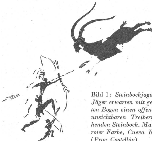
Bild 1: Steinbockjagd. Zwei Jäger erwarten mit gespannten Bogen einen offenbar vor unsichtbaren Treibern fliehenden Steinbock. Malerei in roter Farbe, Cueva Remigia (Prov. Castellón).

Mühsam schleppt sich unser Autocar auf der vom Meere gegen Ares del Maestre führenden Straße durch die bergige Maquis-Landschaft der Provinz Castellón. Weit und breit sieht man nichts als niedriges Buschwerk und felsige Hügelzüge. Von ein paar Häusern aus führt ein steiler