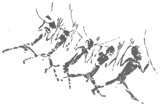
Bild 2: «Kriegerzug», bestehend aus vier zum Teil bärtigen (?) Männern und ihrem Anführer. Dieser zeichnet sich durch einen größeren Kopfputz aus und unterscheidet sich auch dadurch, daß er seinen Bogen in der linken, die Pfeile in der rechten Hand hält, während die übrigen ihre Waffen umgekehrt tragen. Malerei in grauschwarzer Farbe, Cuvea Remigia (Prov. Castellón).

Der Barranco de Gasulla mit seinen verschiedenen bemalten Felsnischen ist eine der wichtigsten Fundstellen der sogenannten Levantekunst. Weitere Malereien dieser Art sind in der Nähe,