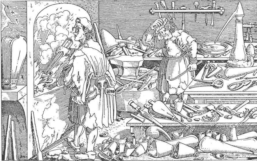
Alchimistenwerkstatt um 1500

Das Bild stammt aus Petrarca, Trostspiegel: Von großer Torheit der Alchimisten.