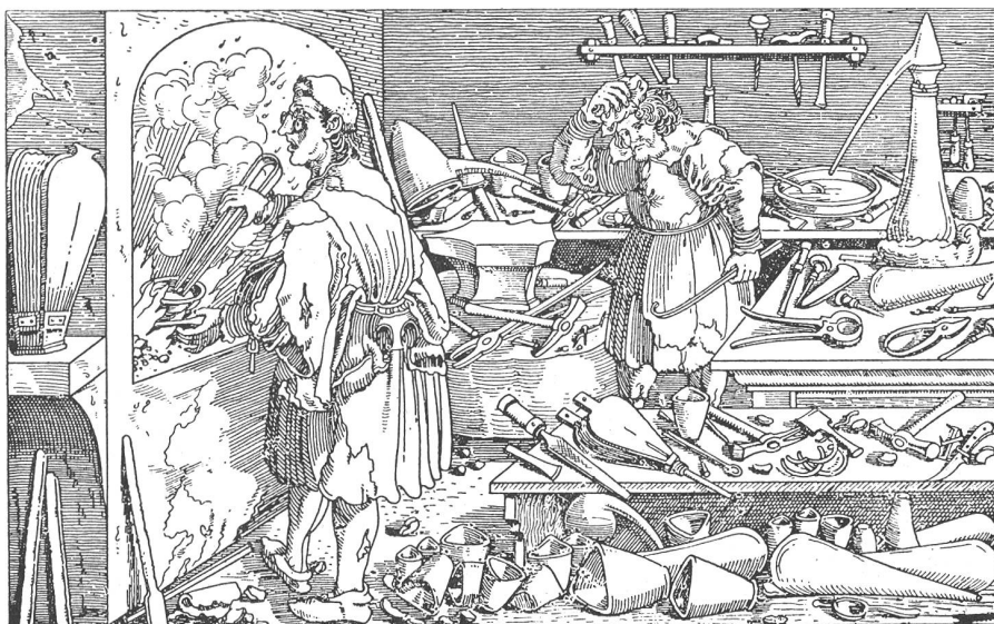
Alchimistenwerkstatt um 1500

Das Bild stammt aus Petrarca, Trostspiegel: Von großer Torheit der Alchimisten.