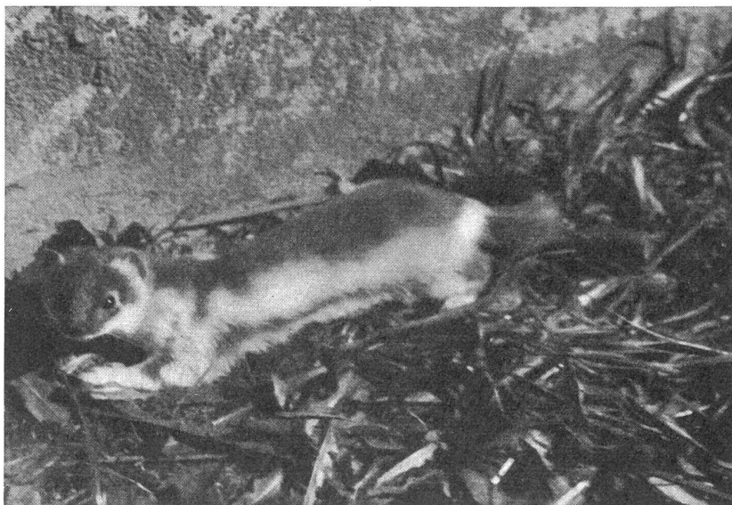
Bild oben: Hermelin in «Sommerpelz», jedoch mitten im Winter, am 23. Jan. 1943 aufgenommen