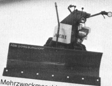
Mehrzweckmaschine AEBI KM51