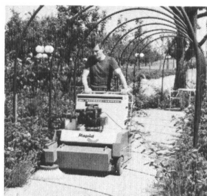
Gutbrod B 751 ideal für den Hauswart

Kehr- maschinen für vielfältigen Einsatz