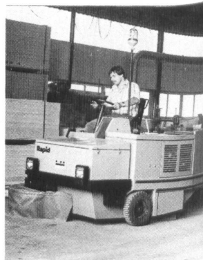
Dulevo 120 für grosse Areale und Plätze