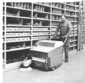
Gutbrod B 601 für enge Wege im Lager

Richtige Beratung Echter Kundendienst Ihr Vorteil