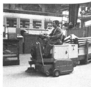
Gutbrod B 801 für grössere Areale