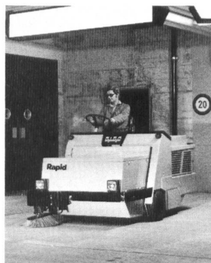
Dulevo 90 enorme Flächenleistung