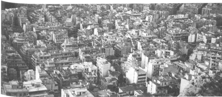
Abb. 4b. Athen – die kompakte Stadterweiterung mit dem hohen Ausnutzungsgrad der Baugrundstücke überrollt das Umland wie eine Betonlawine.