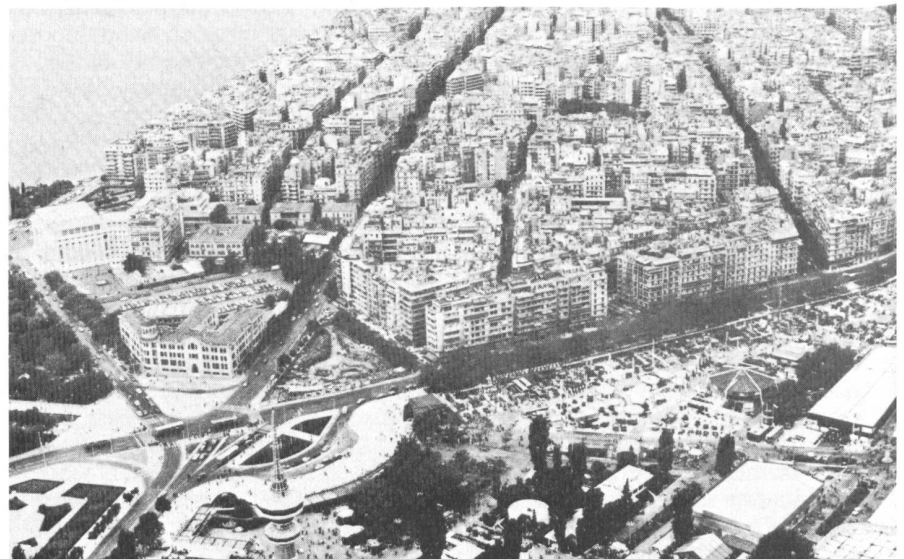
Abb. 4a. Das Zentrum von Thessaloniki ist gekennzeichnet durch geschlossene Bauweise und eine sehr hohe Ausnutzungsziffer. Folgen davon sind mangelhafte Belichtung und Belüftung der Wohnungen sowie übermässige Lärmentwicklung in den schluchtartigen Strassenzügen.