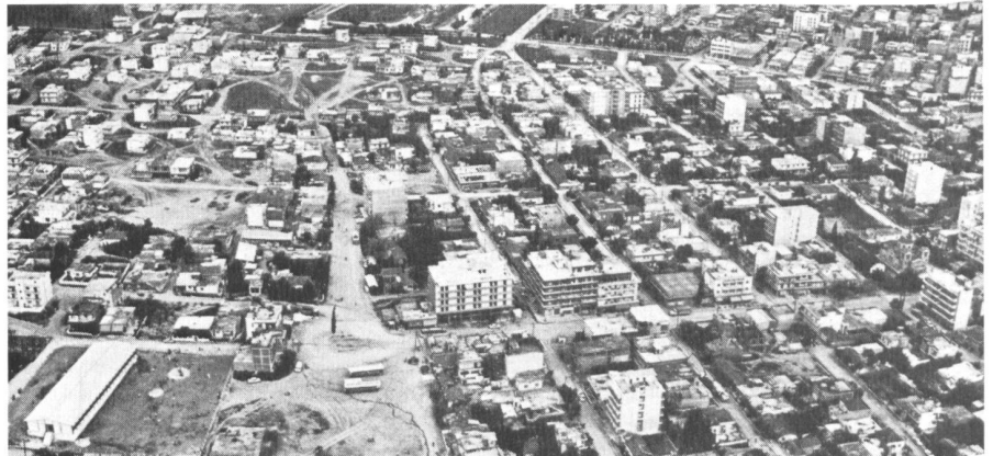
Abb. 3. Illegal in den sechziger Jahren entstandenes Stadtviertel Erosmos mit 35 000 Einwohnern im NW-Teil der Stadt Thessaloniki. Die geraden Strassen wurden nachträglich durchgezogen.

In der Regel hat die kommunale Selbstverwaltung weder die gesetzlichen Voraussetzungen noch die finanziellen Mittel, um eine systematische Stadtplanung zu betreiben. Denn weder die Gemeinden noch die Städte haben