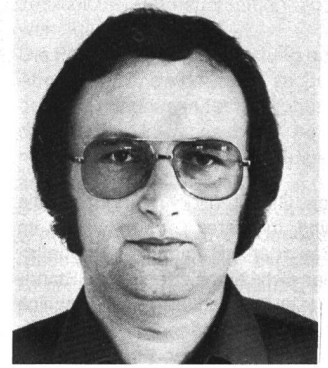
Für den «plan» berichtet aus Bern Bruno Frangi, Bundeshausredaktor

Der Bundesrat beantragt dem Parlament, gestützt auf das neue Raumplanungsgesetz, das auf den 1. Januar 1980 in Kraft gesetzt worden ist, einen Rahmenkredit von 15 Mio. Franken für die Jahre 1980 bis 1984. Der Bund hat bereits bisher die Bestrebungen auf dem Gebiet der Raumplanung finanziell unterstützt. Von 1965 bis 1973 wurden, gestützt auf das Bundesgesetz zur Förderung des Wohnungsbaus, Bundesmittel zur Verfügung gestellt. 1974 und 1977 wurden weitere Kredite bereitgestellt. Seit 1965 hat der Bund für die Raumplanungsarbeiten der Kantone und Gemeinden insgesamt rund 54 Mio. Franken aufgewendet. Der Bundesrat beantragt den eidgenössischen Räten nun, gestützt auf das neue Raumplanungsgesetz, einen Rahmenkredit von 15 Mio. Franken für die kommenden fünf Jahre. Aufgrund des neuen Raumplanungsgesetzes werden durch den Bund nunmehr an die Richtpläne der Kantone Beiträge ausgerichtet. Der Höchstsatz des Bundesbeitrages für finanzschwache Kantone beträgt 30 % und für finanzstarke 15 %. Im Rahmen der neuen Vollzugsverordnung sind die Einzelheiten der subventionsberechtigten Arbeiten umschrieben.