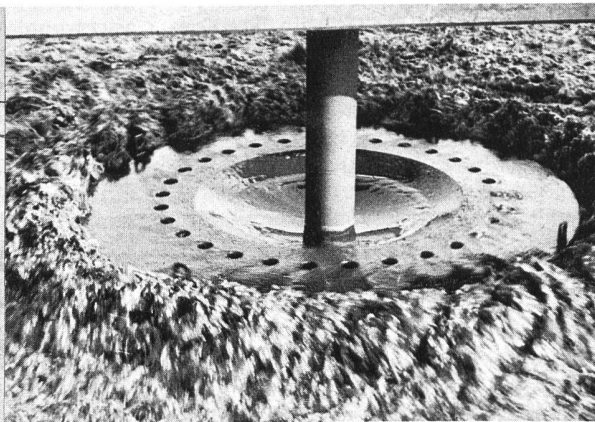
Die Belüftungsbecken sind mit je zwei Oberflächenbelüftern ausgerüstet, welche die Bakterien des Belebtschlammes mit Sauerstoff versehen. Zugleich sorgen sie für die Durchmischung des Beckeninhaltes.

Das am Rechenrost angeschwemmte Rechengut wird über einen maschinell angetriebenen Greifer nach oben gefördert, auf ein Förderband abgeworfen und in einen Container transportiert. An das Rechengebäude schliesst sich der Sandfang an, der als Rundsandfang ausgebildet ist. Durch den tangential angeordneten Zulauf in Verbindung mit einem Paddelrührwerk entsteht eine Kreisströmung, die den Sand in die flachen Randzonen des Sandfanges trägt, wo er sich ablagert. Vom Sandsammelraum aus wird der Sand über eine Mammutpumpe in transportable Mulden mit eingebauter Drainage gefördert, wo er entwässert und später auf eine Deponie gebracht wird.