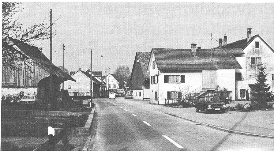
Anhand von fotografischen Aufnahmen (Beispiel oberes Bild Rällikerstrasse) wurde festgehalten, welche Gebäude für den Strassenraum und damit für das Gesicht des Dorfes massgebend sind. Der Teilzonenplan bezeichnet die so ausgezeichneten Gebäude in dem Sinne, dass sie entweder umgebaut oder nur im gleichen Volumen wieder aufgebaut werden dürfen.

Aufgrund der Grundlagenstudien wurde bald klar, dass das Ziel, sinnvolle Ergänzung der bestehenden Baustruktur, nur mit traditionellen Bauformen zu erreichen sei. Es geht also darum, einerseits bestehende Häuser zu erhalten, sie – wenn nötig – sachgemäss zu renovieren und neue Gebäude in Situation, Ausmass, Bauform und