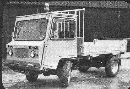
AC 1400 K der moderne Kommunaltransporter auf den Sie gewartet haben!

Rapid Ihr Partner in der Kommunaltechnik