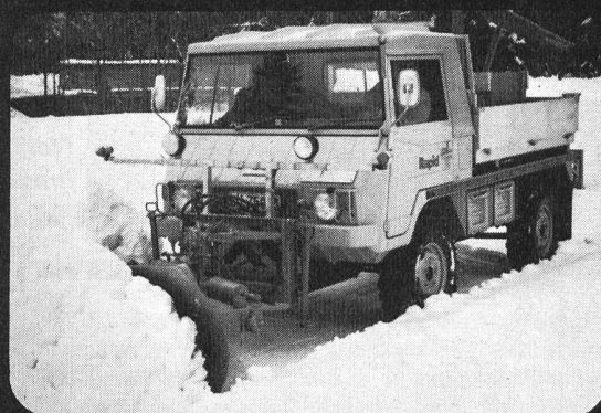
Kommunal-Pinzgauer Das ideale Fahrzeug, das den individuellen Gegeben- heiten jeder Gemeinde angepasst werden kann