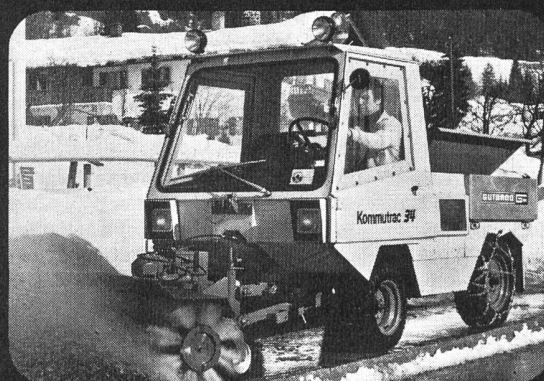
Kommutrak 34 Kleintransporter für professionellen Ganzjahres- Einsatz im Kommunaldienst