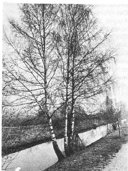
Abb. 2. Birkengruppe an Bachufer

meinden Beispiele einer guten Gestaltung für typische Landschaftselemente wie Waldränder und Ufer aufzeigen lassen. Für die Gestaltung des Glattnlaufes wurden zum Beispiel folgende Massnahmen vorgeschlagen: