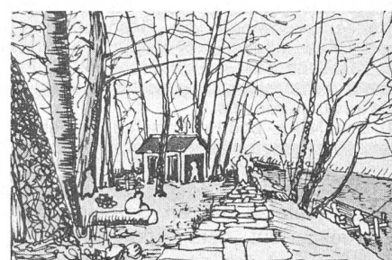
Abb. 3. Gestaltungsvorschlag für einen Flussuferbereich

Wir wissen, dass es in jeder Gemeinde Naturbegeisterte gibt, die mit Freuden geeignete Massnahmen vorschlagen und, wenn das Gemeinwesen einlenkt, an der Realisierung selbst tatkräftig mithelfen.