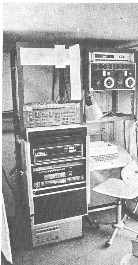
Mobiler Strahlungsmesswagen Rechts im Bild steht einer der sieben Solarimeter, der die kalorische Strahlung von Sonne und Himmel sowie die Reflexstrahlung der Umgebung misst. Alle Messgeräte und auch die Fischaugenkamera sind mit einem

Wie an der Pressekonferenz in Blauen durch die Schweizer Baudokumentation zu erfahren war, wird der mobile