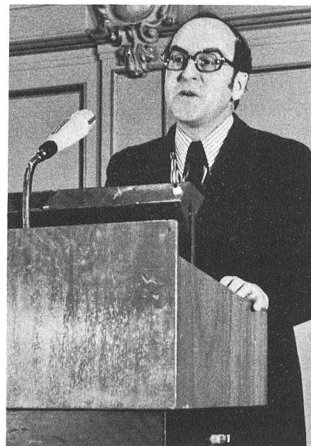
Bundesrat Dr. Kurt Furgler, Vorsteher des Eidgenössischen Justiz- und Polizeidepartements, bei seinem stark beachteten Referat «Raumplanung als föderalistische Aufgabe in der Zeit des Konjunktureinbruchs»

Gemeinden verlieren, ohne dass sich diese Gemeinden dem Nutzen entsprechend an den Kosten beteiligen;