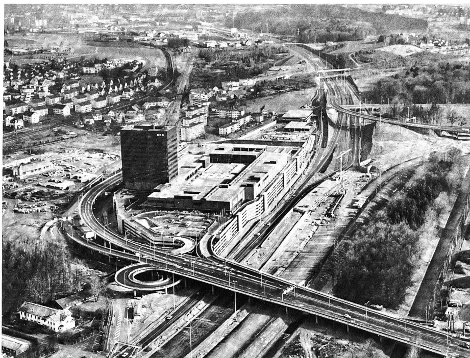
Das grösste Einkaufszentrum der Schweiz: «Glatt» bei Wallisellen

zu begrenzen und dort, wo es möglich ist, zu mildern, konnte sich auch unser Ausschuss in seiner Sitzung vom 3. Dezember 1974 mit der Gesetzesvorlage nicht befrenden. Auch unsere Vereinigung wird daher zu jenen Organisationen gehören, die – wohl mit guten Aussichten auf Erfolg – die Ausarbeitung eines wesentlich konkreteren und für Parlament und Stimmbürger überblickbaren Gesetzes fordern. Es kann der VLP deswegen um so weniger ein Vorwurf gemacht werden, als deren Direktor schon in der ersten Sitzung der Expertenkommission des Bundes den Antrag gestellt hatte, auf einen die Materie des Umweltschutzes «gesamtheitlich» umfassenden Entwurf zu verzichten und sich damit zu begnügen, rasch Spezialgesetze über den Immissionschutz, über den Schutz der natürlichen Güter usw. vorzulegen.