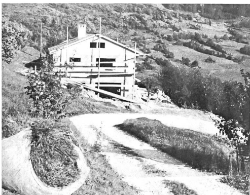
Ferienhäuser an landwirtschaftlichen Erschliessungswegen: ein Bild, das der Vergangenheit angehören sollte!

ken. Dieser Brief hat uns seiner Ehrlichkeit wegen tief gefreut, aber uns gleichzeitig um so mehr Sorge gemacht, als die Gemeinde von einer grossen Agglomeration nicht allzu weit entfernt liegt. Aber nicht nur diese Gemeinde, unzählige andere auch sind immer weniger in der Lage, ihre Aufgaben zu erfüllen. Hierin liegt die Gefahr, dass die Gemeindeautonomie zur Farce herabsinkt und ein Instrument dazu bietet, möglichst lange zulasten der Öffentlichkeit Fehler über Fehler machen zu dürfen. Wir zählen uns zu jenen, die aus Erfahrung wissen, dass sich in der Gemeinde entscheidet, «was leuchten soll im Vaterland». Bei den ständig steigenden Anforderungen an eine zweckmässige Regierung und Verwaltung der Gemeinden können sich aber die Kantone nicht mehr allzu lange der Aufgabe entziehen, Mittel und Wege zu suchen, um die Funktionsfähigkeit der Gemeinden sicherzustellen. In den uns zunächst liegenden Belangen könnte wohl die Bildung regionaler Bauverwaltungen einen beachtlichen Beitrag leisten.