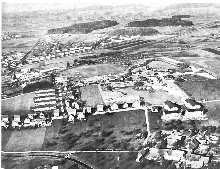
Zu grosse und zum Teil «groberschlossene Baugebiete»: die Kraft der Fakten!

Wir-Hegi können wir eindeutig feststellen, dass das Gebilde «Teilzeiteigentum» rechtlich nicht möglich ist und darum nicht ins Grundbuch aufgenommen werden darf. ... Das Stockwerkeigentum lässt nur eine räumliche Aufteilung des Eigentums an Liegenschaften auf einem Grundstück zu und nicht auch eine zeitliche. Wollen mehrere Personen eine Wohnung zu Eigentum erwerben und deren Nutzung zeitlich staffeln, so müssen sie die Wohnung als Miteigentümer erwerben und für die Nutzung und Verwaltung eine bestimmte Ordnung vereinbaren, die im Grundbuch angemerkt werden kann (Art. 647 Abs. 1 ZGB). Damit verbunden oder getrennt können sie einen Mietvertrag abschliessen, wonach jeder für eine bestimmte Zeit im Jahr dem anderen seinen Miteigentumsanteil mietweise überlässt. Eine solche Regelung kann sinnvoll sein und wird kaum zur weiteren Bodenspekulation Anlass geben.»