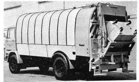
Abb. 1. Kuka-Müllwagen sind in jedem Falle mit einer Container-Schüttung versehen. Dank dem steilen Einkippwinkel können die Behälter mühelos entleert werden

Ausführliche Auskünfte: kunz maschinen ag, CH-3400 Burgdorf, Telefon 034 22 55 55